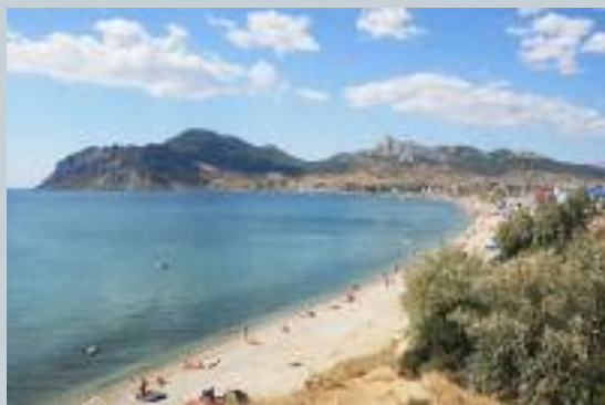
Восточный берег Крыма