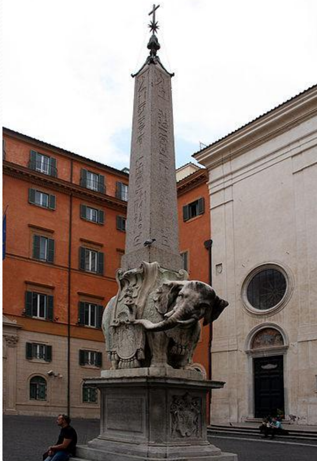
«Слон Минервы» перед Санта-Мария- сопра-Минерва