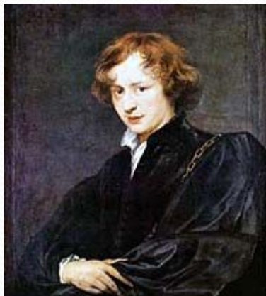
Антонис Ван Дейк. Автопортрет. Первая треть 17 века. Старая Пинакотекa. Мюнхен.

Живописи Рубенса присущи уверенная свободная манера, выразительная пластическая лепка, тонкость красочных градаций. В мастерской Рубенса работали и его ученики: А. Ван Дейк, Я. Йорданс, Ф. Снейдерс.