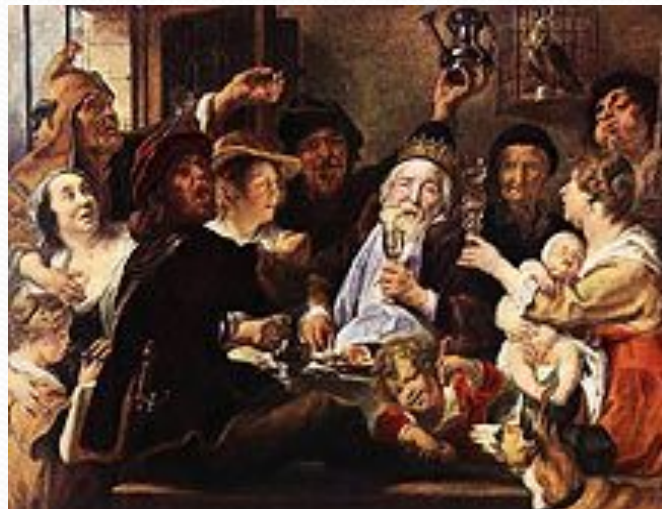
Якоб Йорданс. «Бобовый король». Около 1638. Эрмитаж, Санкт-Петербург.