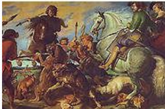
Рубенс. «Охота на лису и волка».