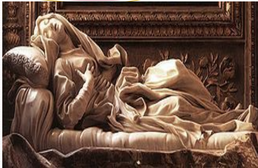
Экстаз Блаженной Людовики Альбертини (1671-1674 гг.)- мрамор, Сан- Франческо-а-Рипа, Рим