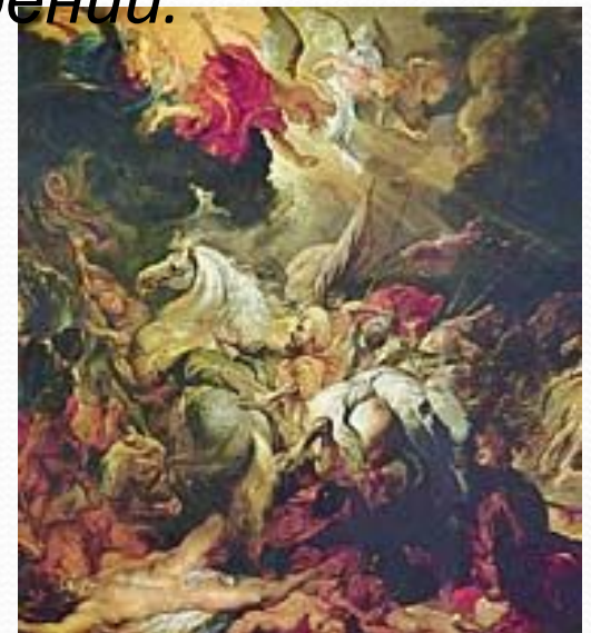
Питер-Пауль Рубенс. Низвержение Сеннахериба. Первая половина 17 века. Дерево. Старая Пинакотека, Мюнхен.