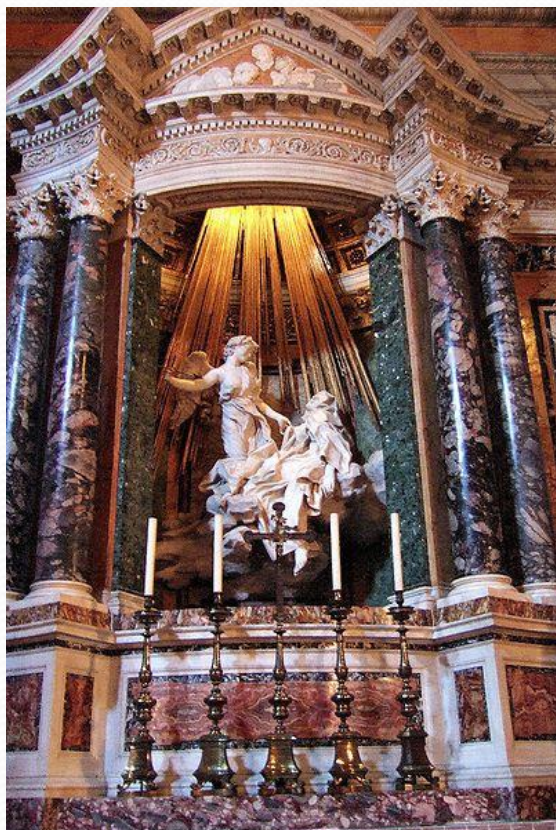
Экстаз Святой Терезы 1645-1652 гг.