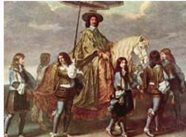
Шарль Лебрэн. Канцлер Сегье верхом на лошади. Около 1660 года. Масло, холст. Лувр, Париж .

Монументальная живопись барокко получила широкое распространение в западноевропейских странах, особенно во Франции. Но здесь она развивалась в рамках уже сложившихся стилей — классицизма XVII в. и рококо, возникшего в начале XVIII столетия.