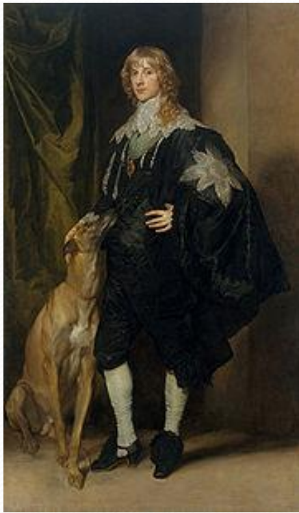
Антонис ван Дейк . Портрет Джеймса Стюарта, ок. 1637

Характерные черты барокко нашли отражение в жанре парадного портрета . Художники видели свою главную задачу в передаче противоречивых чувств и переживаний, тончайших психологических оттенков человеческой души. Вот почему среди портретов XVII в. нет профильных изображений, люди в них обращены лицом к зрителю. Чаще всего это монархи, государственные и общественные деятели, высшая знать — кавалеры и дамы, а также богатые купцы и священники. Величественные позы, гордые, надменные взгляды... Портреты изобилуют множеством символических атрибутов и аллегорических намеков. Сложные драпировки, яркие, запоминающиеся детали, занавесы из тяжелых тканей создают праздничную торжественную атмосферу.