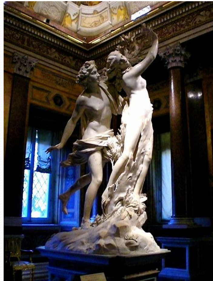
Аполлон и Дафна (1622—1625 гг.) — мрамор, 243 см, галерея Боргезе , Рим.