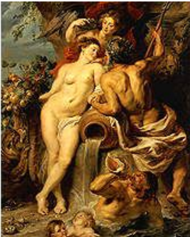
Рубенс. «Союз Земли и Воды». Около 1618. Эрмитаж.

Характерные для барокко приподнятость, патетика, бурное движение, декоративный блеск колорита неотделимы в искусстве Рубенса от чувственной красоты образов, смелых реалистических наблюдений.