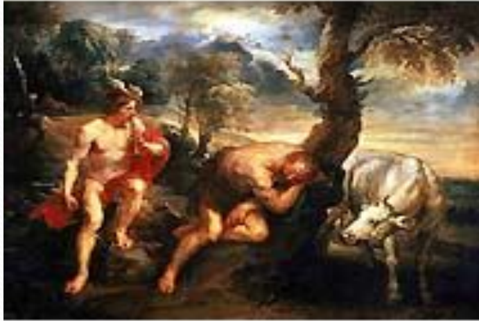
Рубенс. «Меркурий, Аргус и Ио». 1635-38. Картинная галерея. Дрезден.

РУБЕНС (Rubens) Питер Пауль (28 июня 1577, Зиген, Германия — 30 мая 1640, Антверпен), фламандский живописец, рисовальщик, глава фламандской школы живописи барокко.