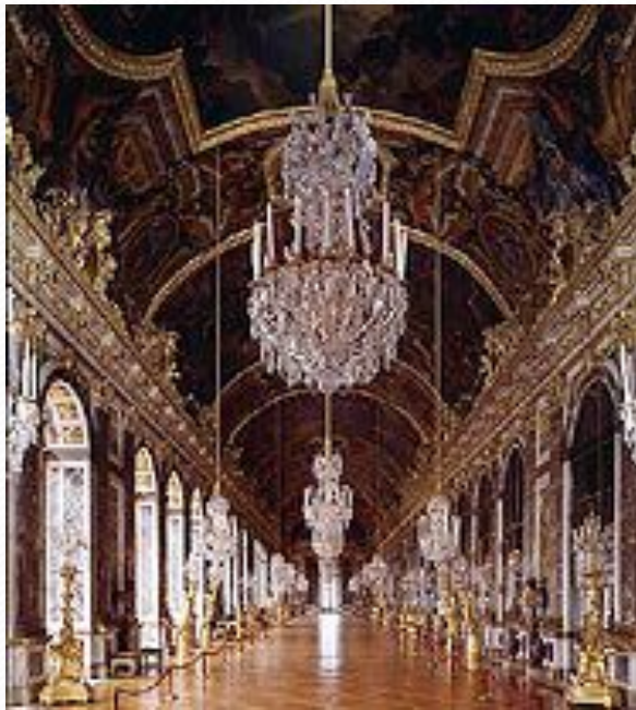
Зеркальная галерея дворца в Версале. Франция.

Поражали своей парадной пышностью декоративные композиции Шарля Лебрена (1619—1690) в Версале и Лувре. Провозглашенный им «метод изображения страстей», предполагавший помпезное и льстивое восхваление высокопоставленных особ, принес художнику головокружительный успех. В 1662 г. он стал первым живописцем короля, а затем директором королевской мануфактуры гобеленов (вытканых вручную ковров-картин, или шпалер) и руководителем всех декоративных работ в Версальском дворце. В Зеркальной галерее дворца (см. ил. на с. 49) Лебрен расписал золоченый плафон множеством аллегорических композиций, прославляющих царствование и завоевания «короля-солнца» Людовика XIV. Нагромождаемые живописные аллегии и атрибуты, яркие краски и декоративные эффекты барокко явно контрастировали с архитектурой классицизма.