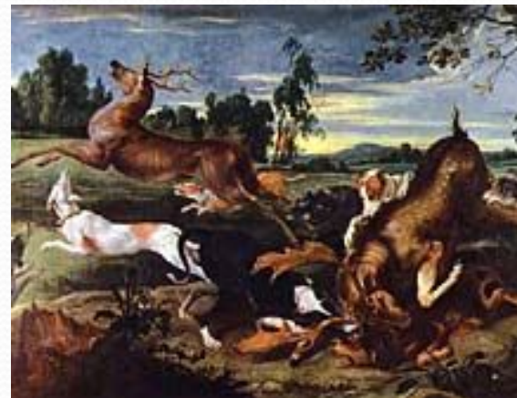
Франс Снейдерс. Охота на оленя. Вторая четверть 17 века. Холст. Королевский музей изящных искусств в Брюсселе.