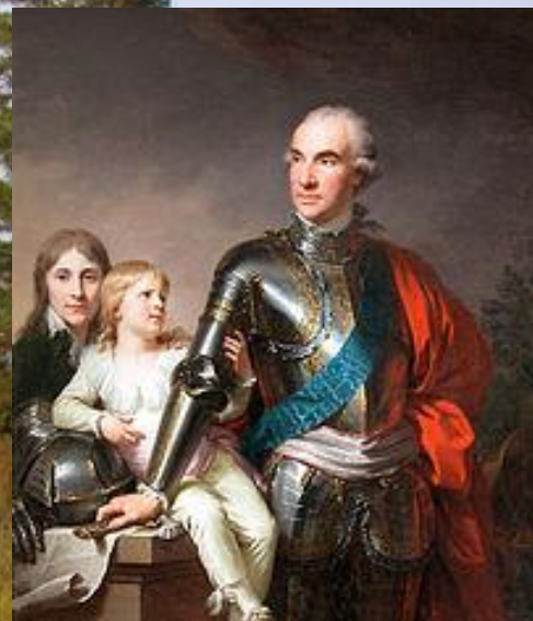
Станіслав Щенсний Потоцький

Парк «Софіївка» заснований у 1796 році власником міста Умані, магнатом Станіславом Щенсним Потоцьким та названий на честь його дружини Софії Вітт-Потоцької. Автором топографічного й архітектурного проекту і керівником будівництва парку було призначено військового інженера Людвіга Метцеля.