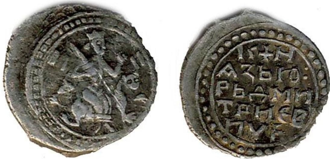
Монеты Юрия Дмитриевича Звенигородского.