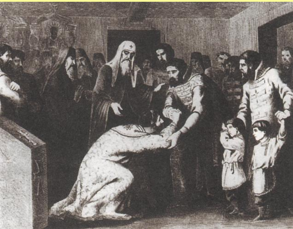
Примирение Василия II с Шемякой. Худ. В.В. Муйжель.

Оба Дмитрия признали себя «братьями младшими» Василия II.