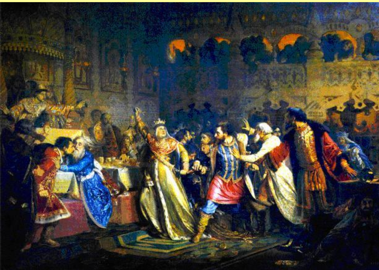
Софья Витовтовна срывает пояс с Василия Косого. Худ. П. Чистяков.

Хрупкий мир был нарушен в 1433 г. Софья Витовтовна женила сына на боровской княжне Марии Ярославне – внучке Владимира Андреевича Серпуховского. Ее брат Василий был в это время серпуховским князем.