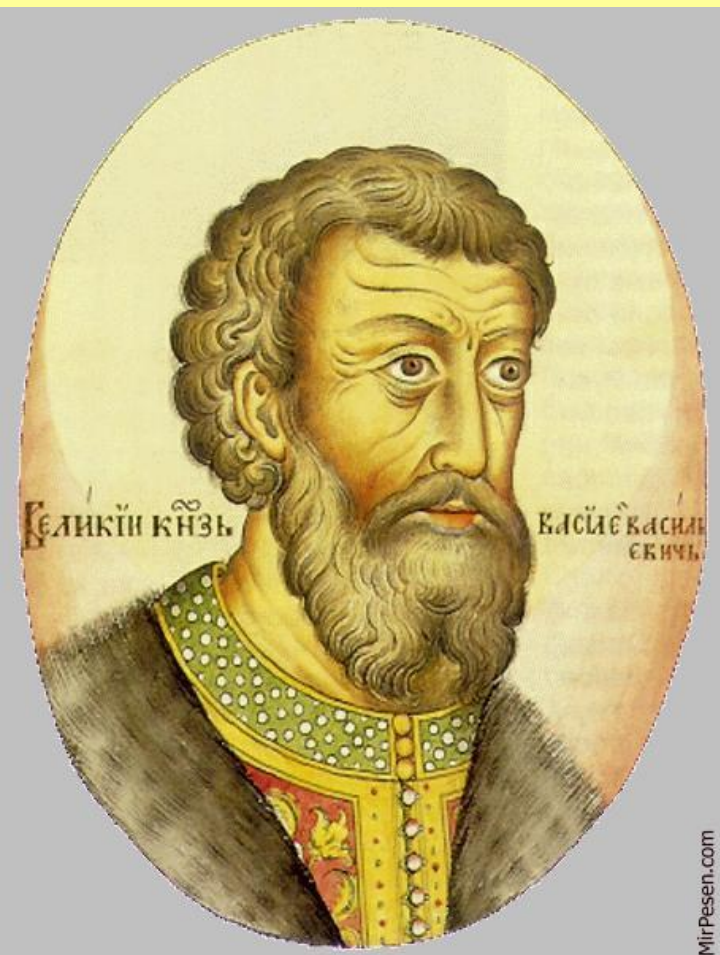
Василий Темный, великий князь Московский

В декабре Василий II вновь овладел Москвой и окончательно занял великокняжеский престол. Дмитрий Шемяка бежал в Галич. В декабре 1447 г. Шемяка заключил окончание с Василием II и признал его «братом старейшим».