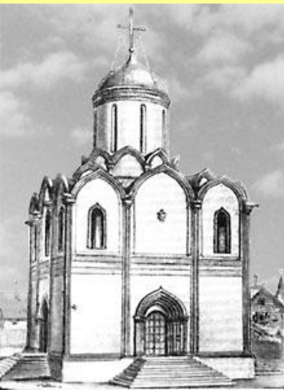
Успенский собор «на Городке» в Звенигороде. Реконструкция. Построен около 1399 г.

В удельном Звенигороде Юрий развернул большое каменное строительство.