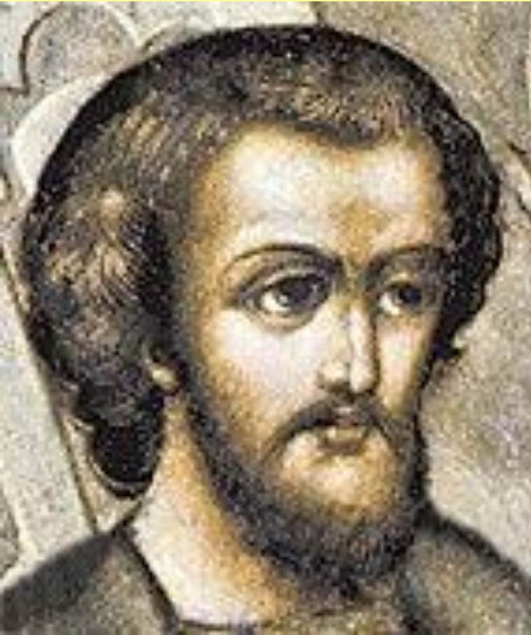
Юрий Дмитриевич, князь Галицкий и Звенигородский, Великий князь Московский в 1433 и 1434 гг..