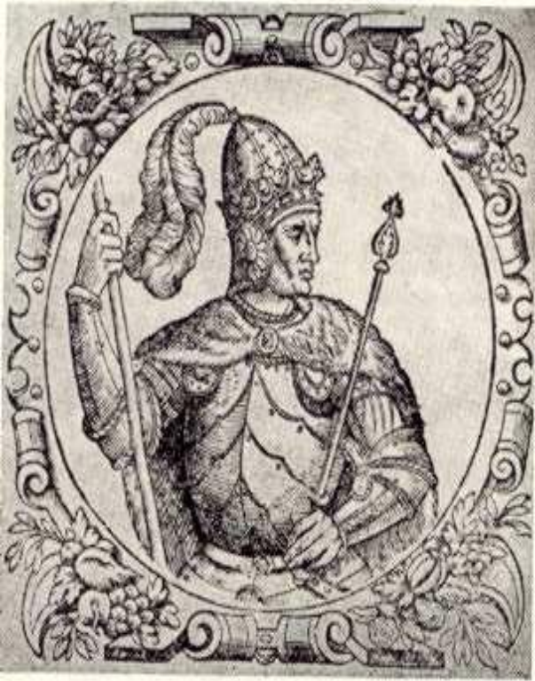
Витовт, великий князь Литовский и Русский

Василий II мог рассчитывать на помощь деда по матери – Витовта.