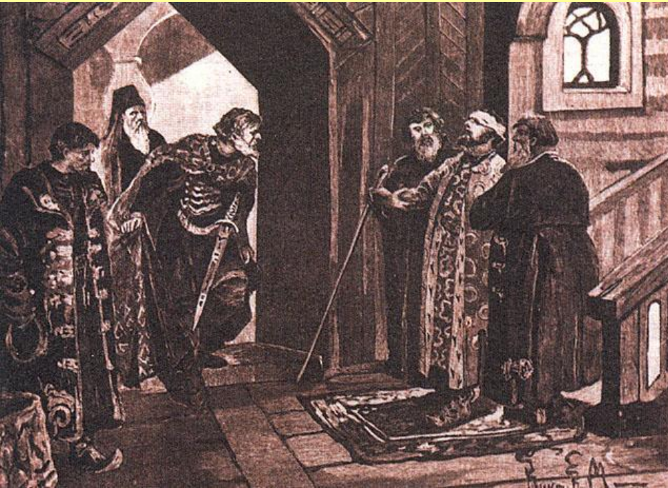
Встреча Дмитрия Шемяки с Василием Темным.

В феврале 1446 г. Василий II выехал в Троице-Сергиев монастырь на богомолье. Воспользовавшись этим, Дмитрий Шемяка «изгоном» захватил Москву, а затем пленил Василия II и ослепил его.