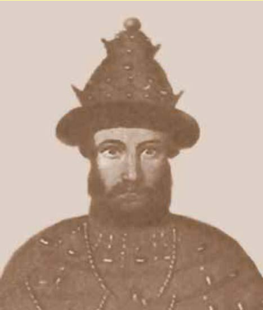
Василий II, великий князь Московский и Владимирский

В 1445 г. Василий II был разбит войсками казанского хана Улу-Мухаммеда и попал в плен.