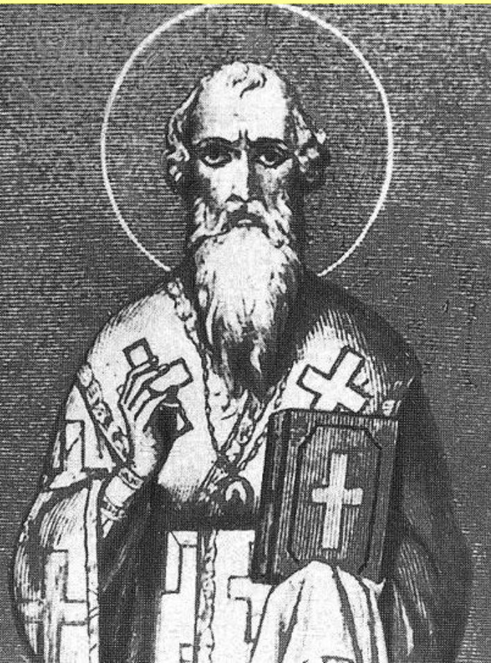
Фотий, митрополит Московский В 1410–1431 гг. Гравюра XIX в.

До 1431 г. Юрию приходилось терпеть Василия II на великом княжении: того поддерживали большинство московских бояр и митрополит Фотий.