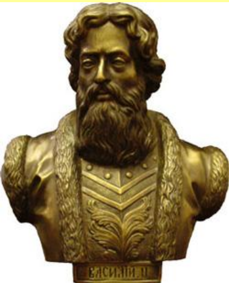
Василий II, великий князь Московский и Владимирский.

Юрию пришлось также собирать повышенный ордынский «выход».