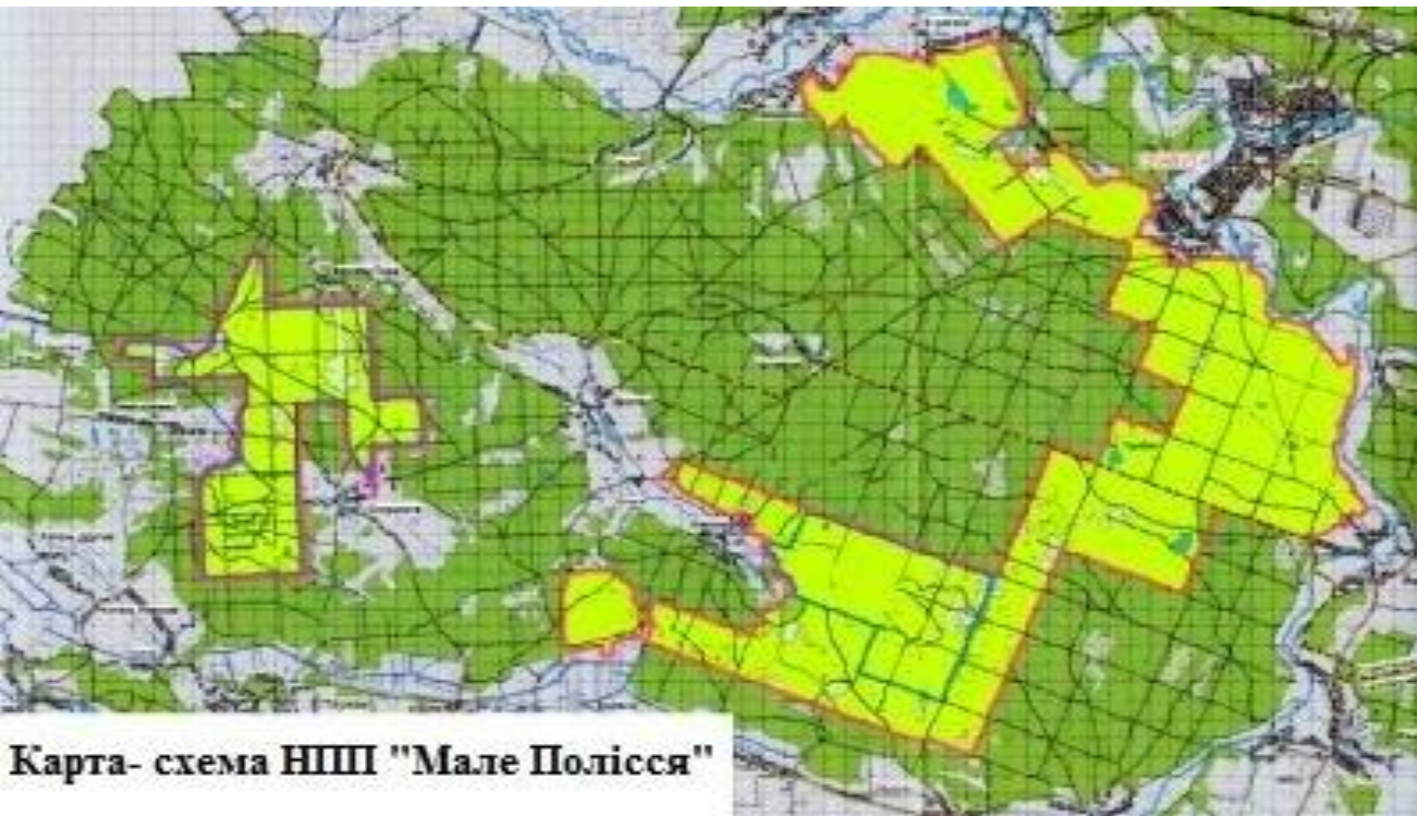
Карта- схема НПШ "Мале Полісся"