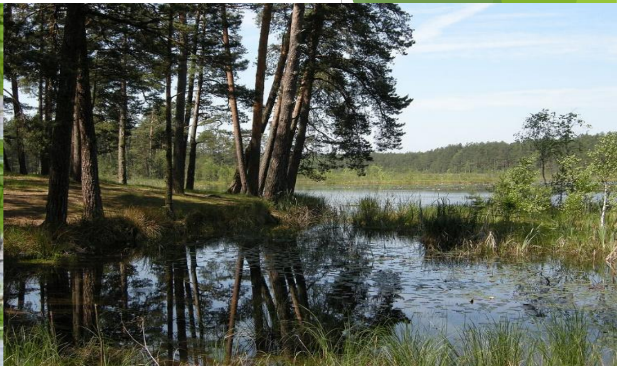
Краєвид НПШ «Мале Полісся»