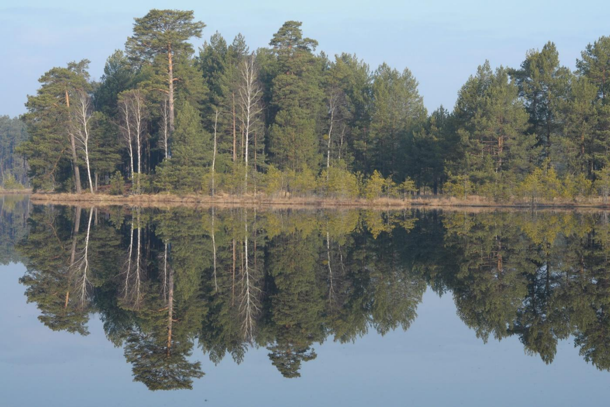
НПП «Мале Полісся»