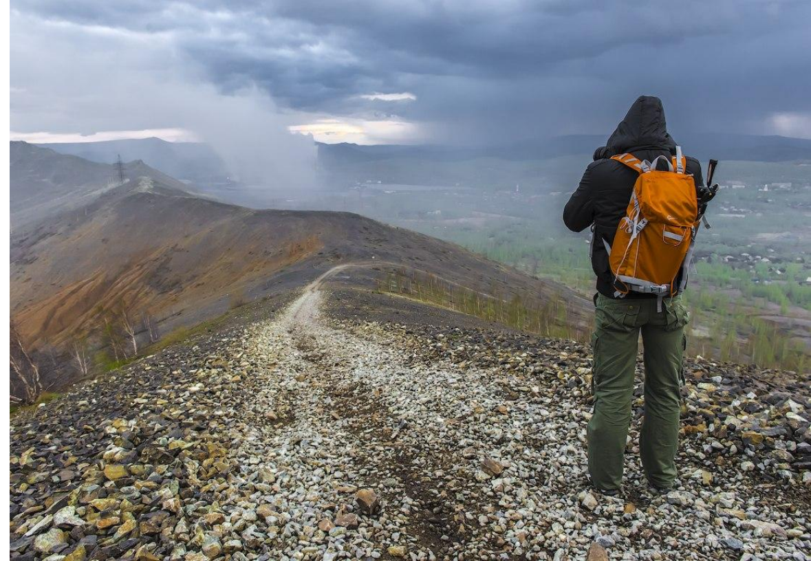
Відвідування туристом національного парку