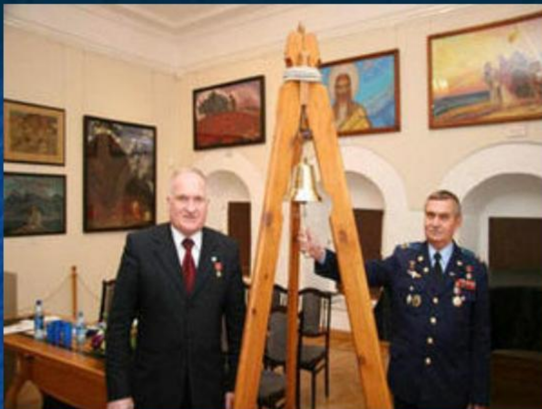
На фото: лётчики-космонавты В. М. Афанасьев и А.Н. Березовой

В России впервые акция «Колокол Мира в День Земли» была проведена в 1998 году в Москве, её организаторами стали Международный центр-музей имени Н. К. Рериха, Международный гуманитарный фонд «Знание», Федерация космонавтики России, Международная Ассоциация фондов Мира.