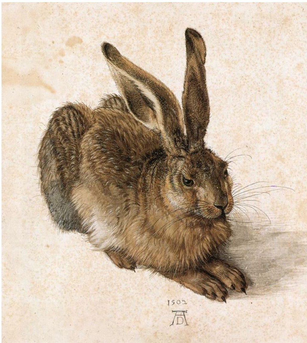
ЗАЯЦ, 1502 Г.

Настороженный заяц на картине выглядит не нарисованным, а живым. Он приподнял одно ухо, его рыжевато-коричневый мех чуть взъерошен, в расширенном зрачке отражается окно. Кажется, что зверёк вот-вот сорвётся с места.