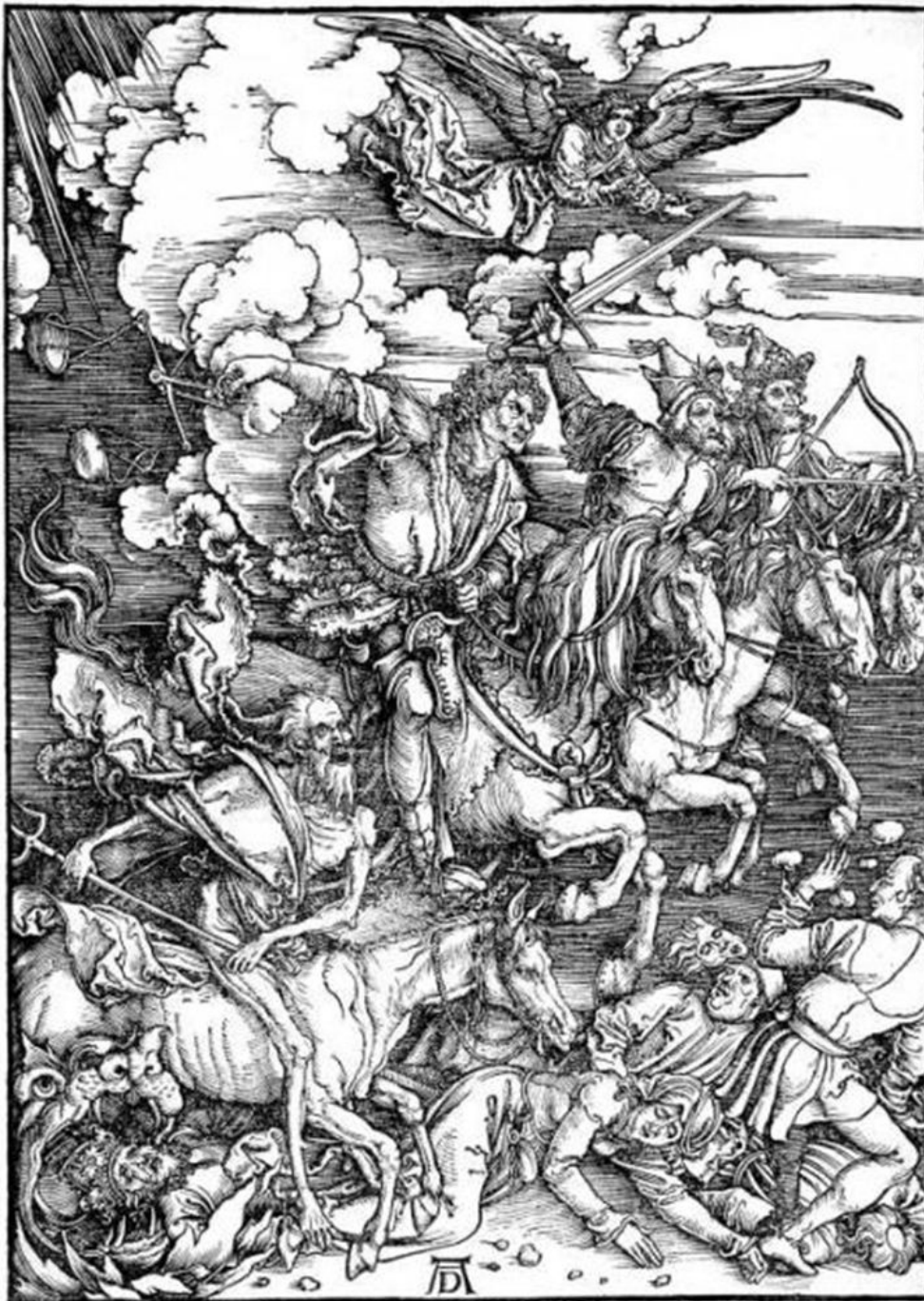
А.ДЮРЕР ЧЕТЫРЕ ВСАДНИКА ИЗ СЕРИИ «АПОКАЛИПСИС». ГРАВИЮРА НА ДОСКЕ. 1497-1498