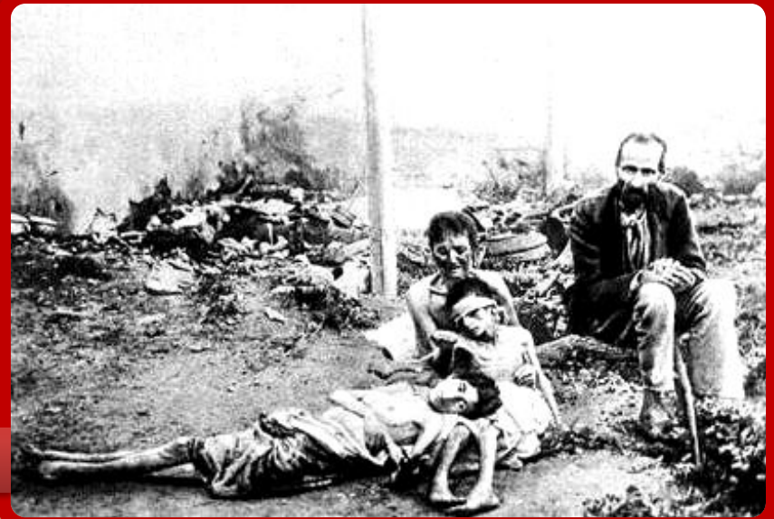
Голодающие на Украине

Массовый «исход» крестьян из деревень, дефицит рабочей силы на селе.