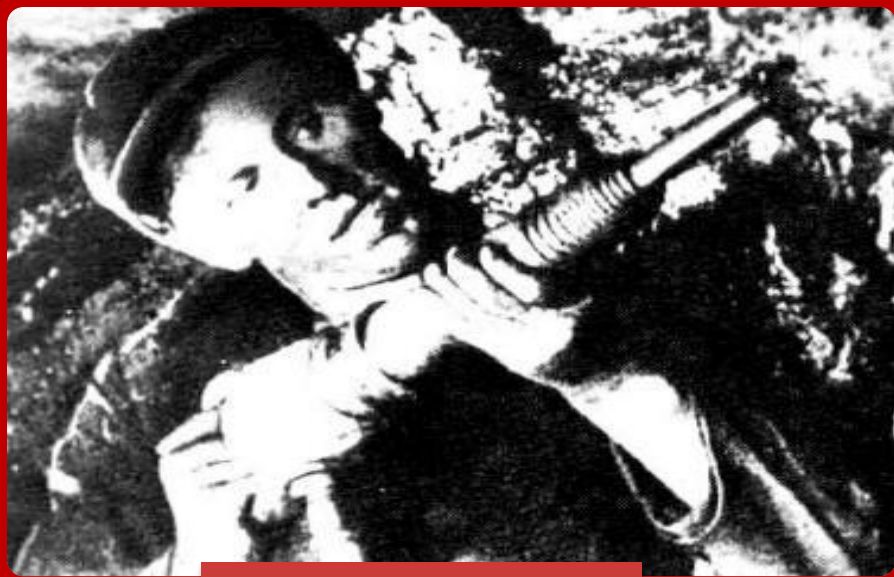
А.Стаханов в шахте

В 1935 г. А.Стаханов превысил норму добычи угля в 14 раз. Его почин распространился и на другие отрасли.