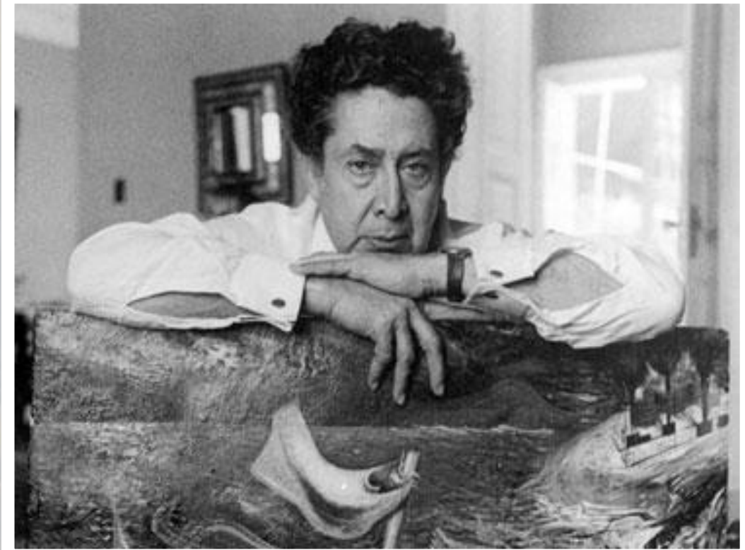
Давид Альфаро Сикейрос

Они изображали проблемы мексиканской революции, модернизацию страны, и классовую борьбу. Искусство ориентировано на широкие массы