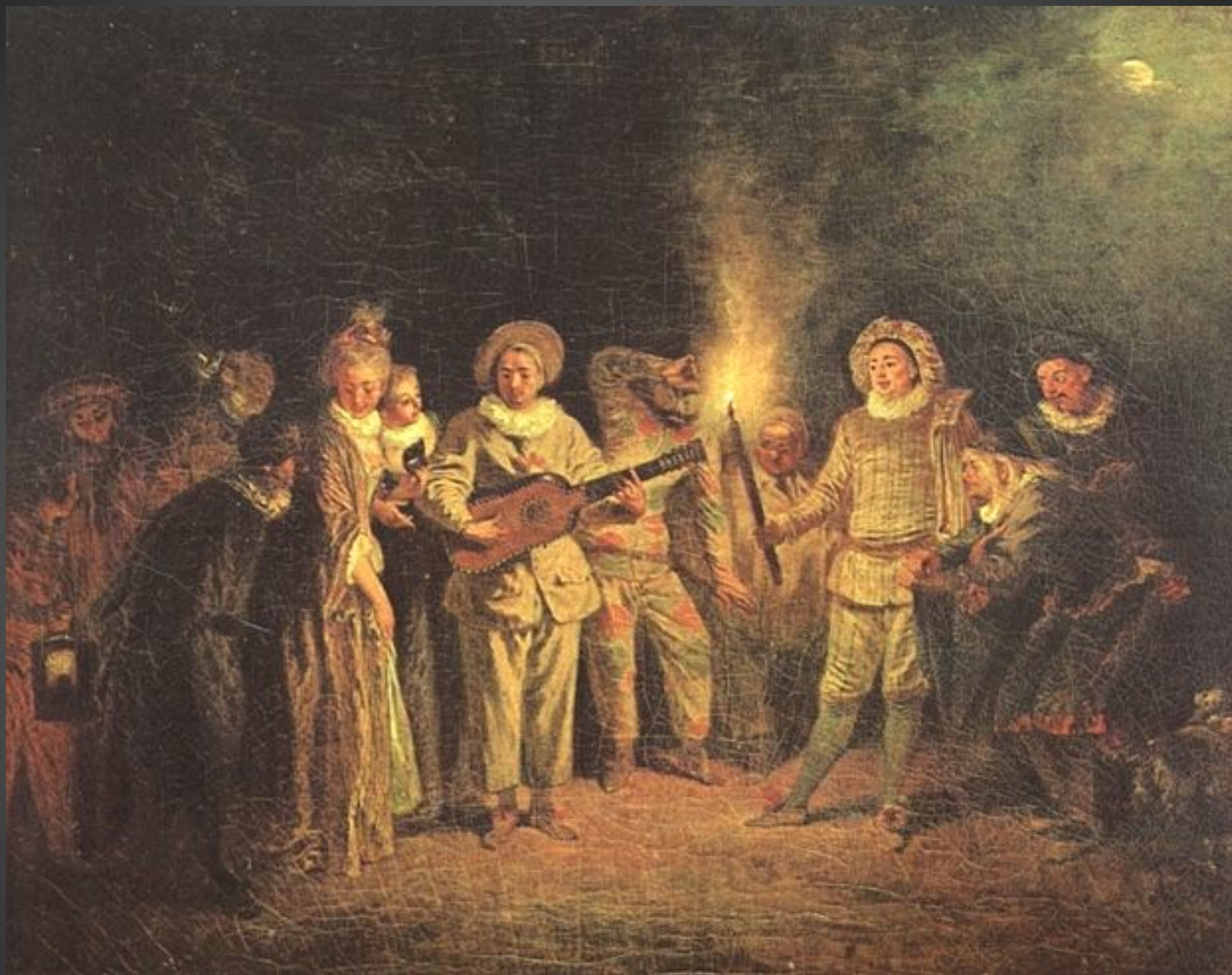
«Актёры итальянской комедии»