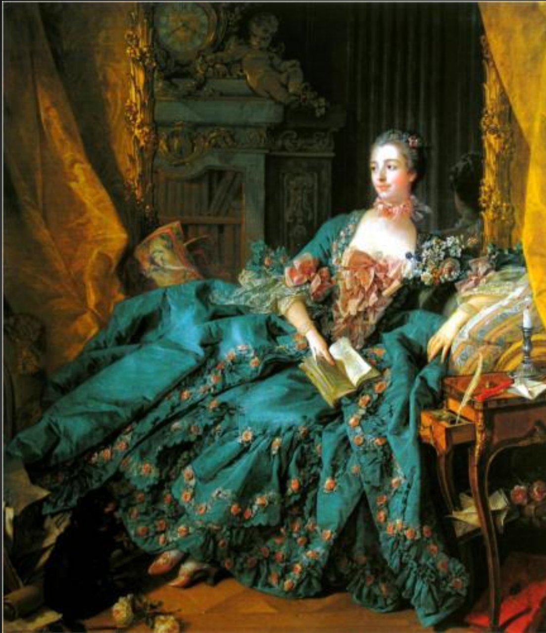
«Мадам де Помпадур»

Одной из главных заказчиц была маркиза де Помпадур, фаворитка короля Людовика XV. Эта дама была законодательницей мод королевского двора, да и всей Европы. Время её славы называют «эпохой Помпадур».