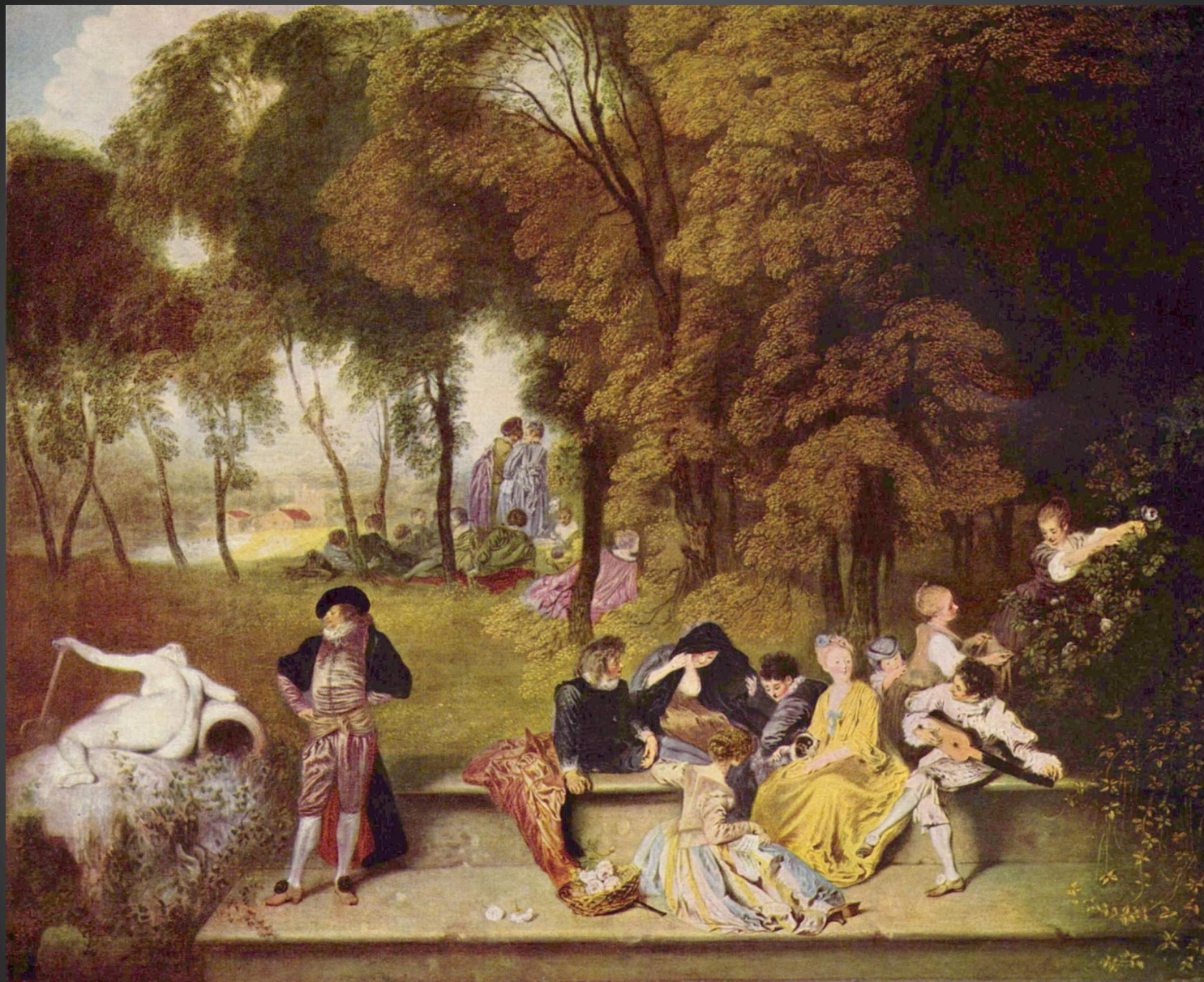
«Общество в парке»