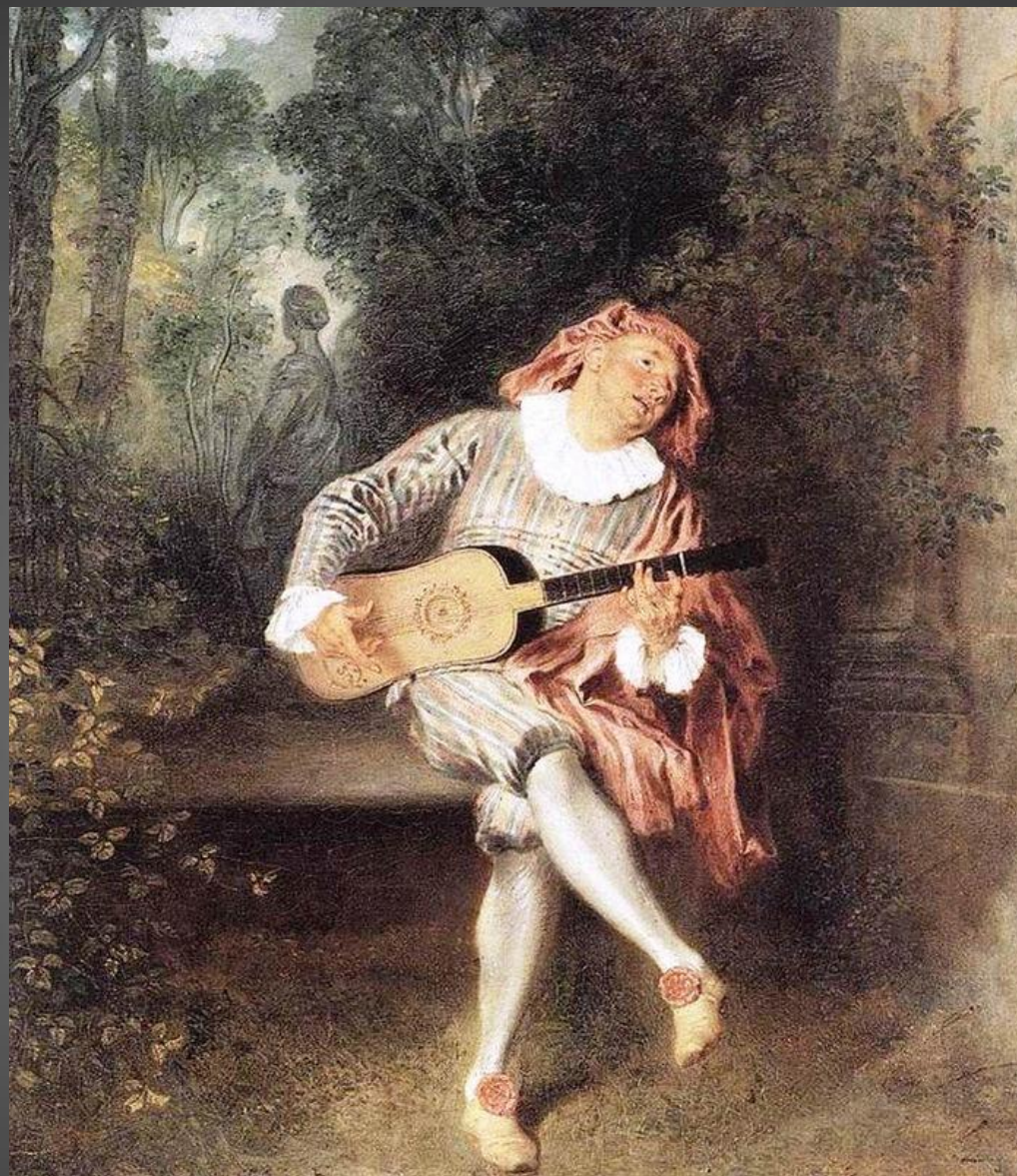
«В одежде Мецетена»