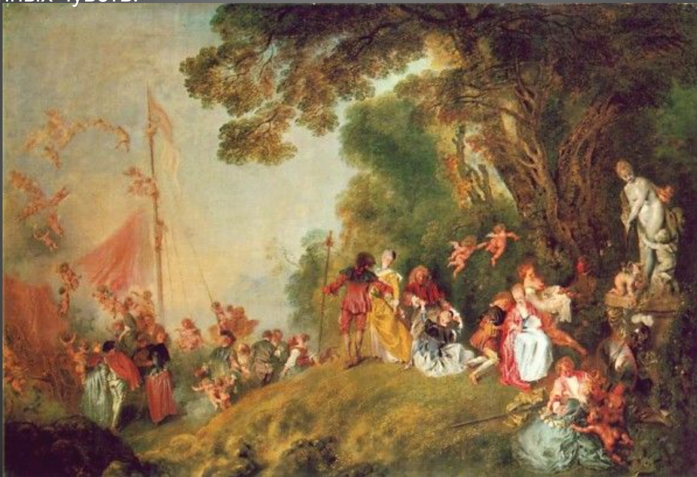
«Паломничество на остров Киферу»

Считается, что Ватто наложил на мифологическую подоснову один из сюжетных мотивов популярной в его годы комедии Флорана Данкура «Три кузины», «в котором упоминался чудесный остров, откуда ни одна девушка не возвращается без поклонника или мужа. Юные героини отправляются со своими возлюбленными на воображаемый остров вечных и ничем не омраченных чувств.