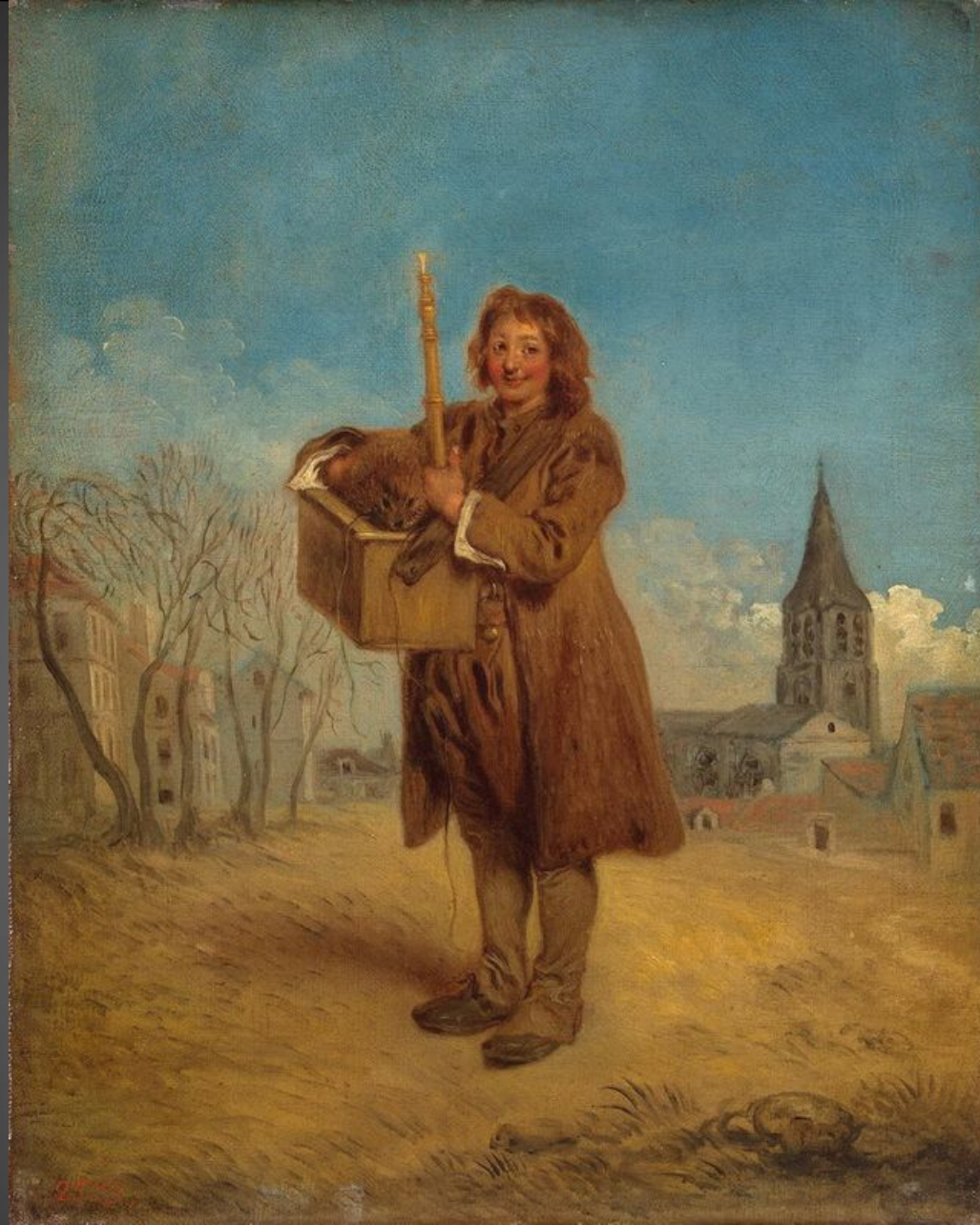
«Савояр с сурком», 1716