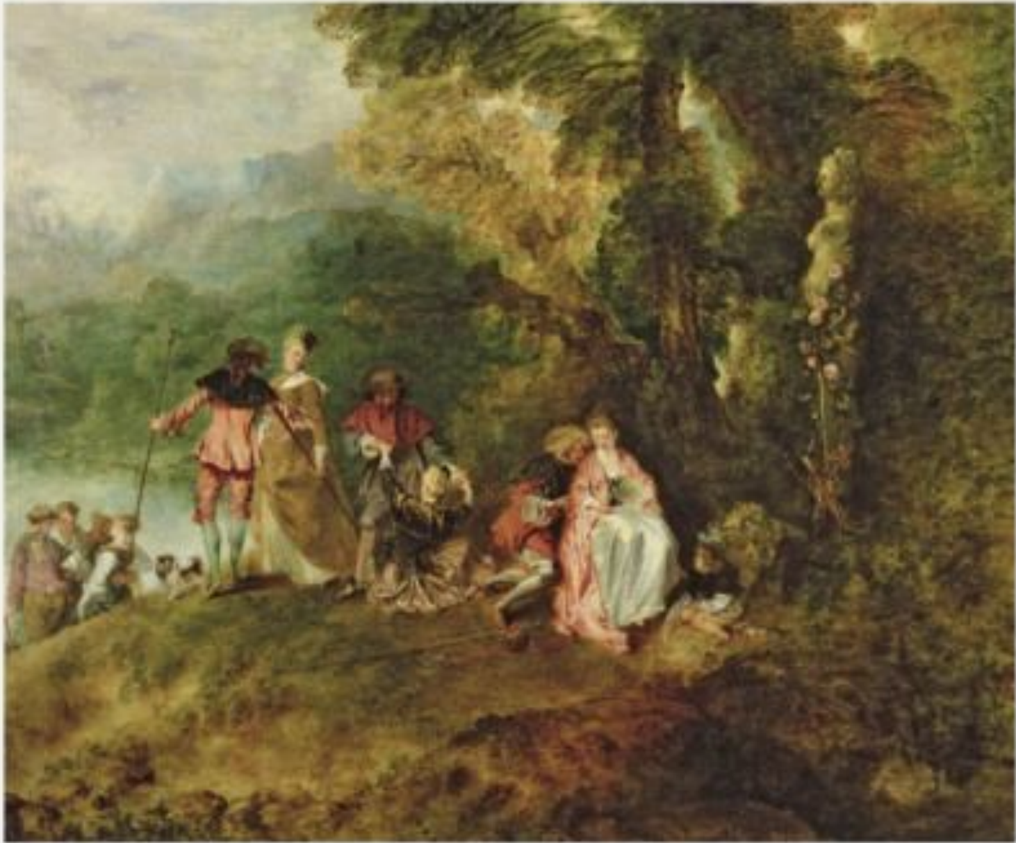
«I алантные празднества»