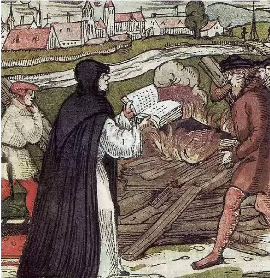
Лютер сжигает папскую грамоту

В 1520 г. Мартин Лютер в присутствии студентов сжег папскую грамоту об отлучении его от церкви.