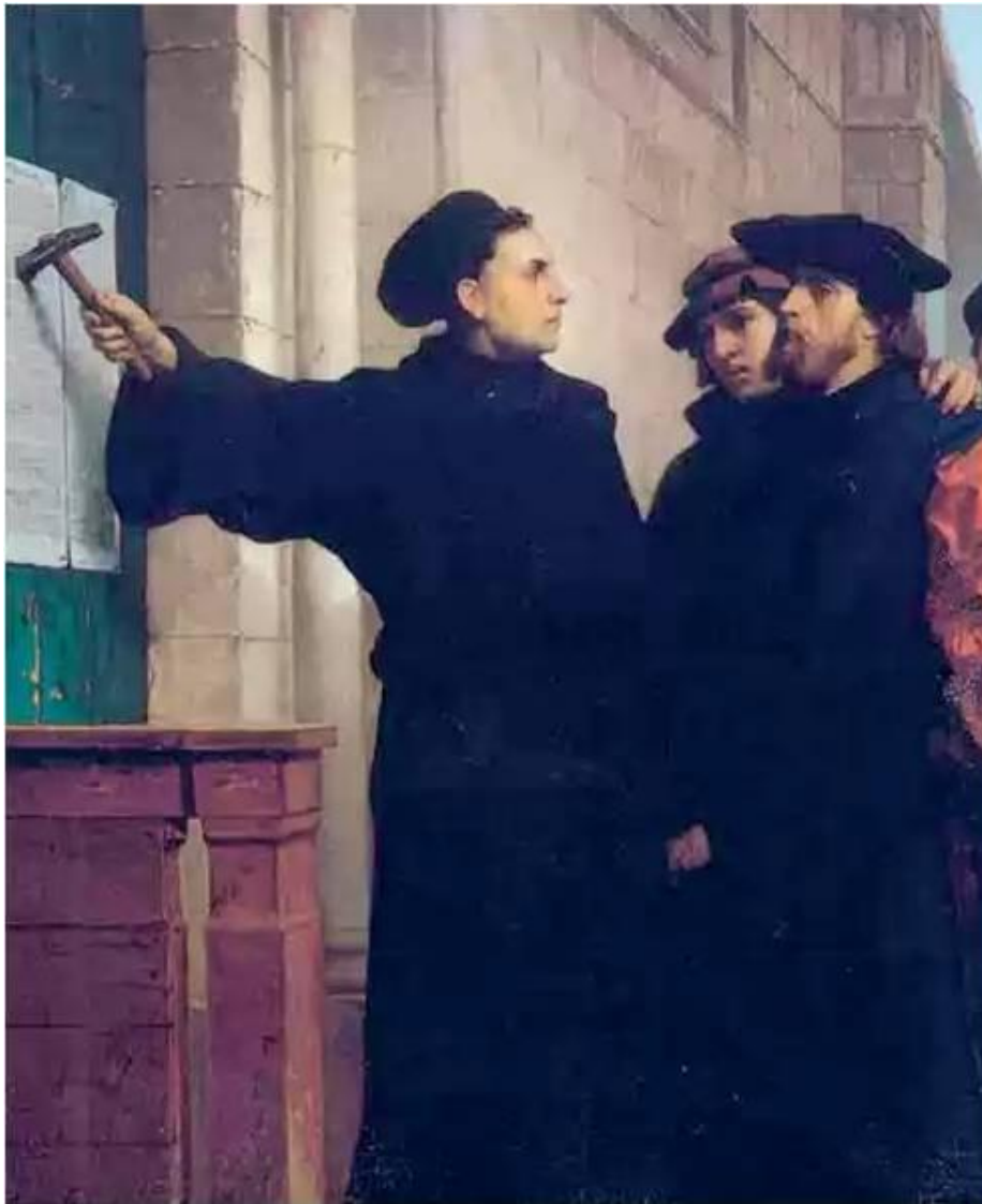
Лютер прикрепляет «95 тезисов» к порталу Виттенбергского собора

31 октября 1517 года Виттенбергский монах Мартин Лютер обнародовал свои « 95 тезисов»: