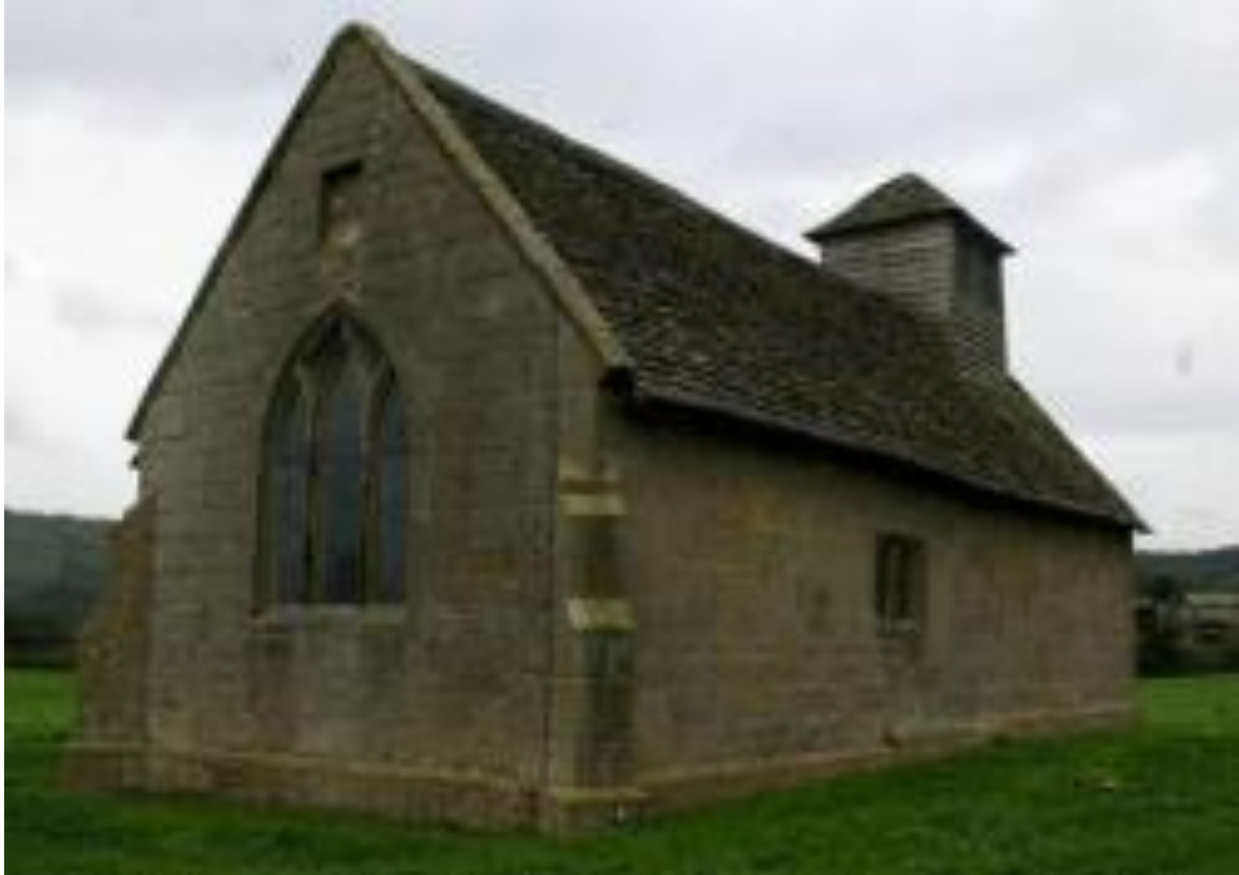
Деревенская церковь, датируемой примерно 1564 годом, в протестантской Англии (часовня Лэнгли)