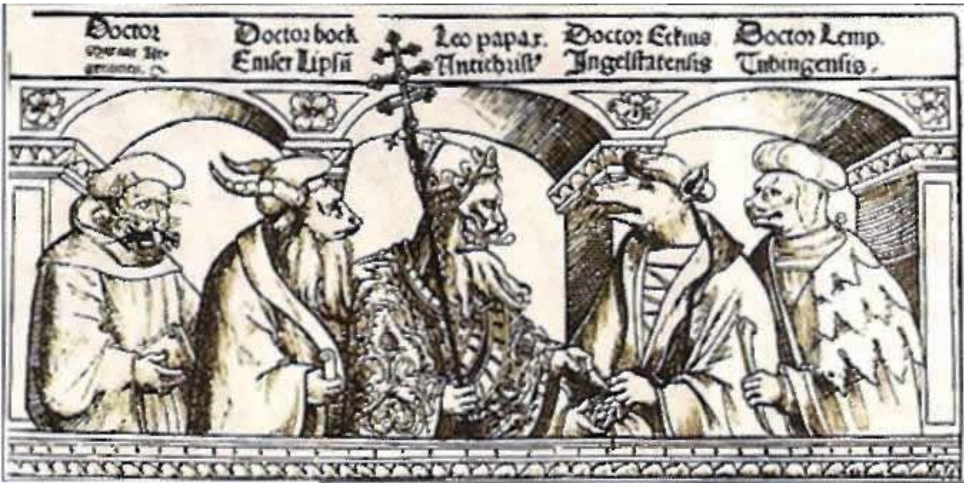
Карикатура на противников реформации. Гравюра появилась около 1520 года.