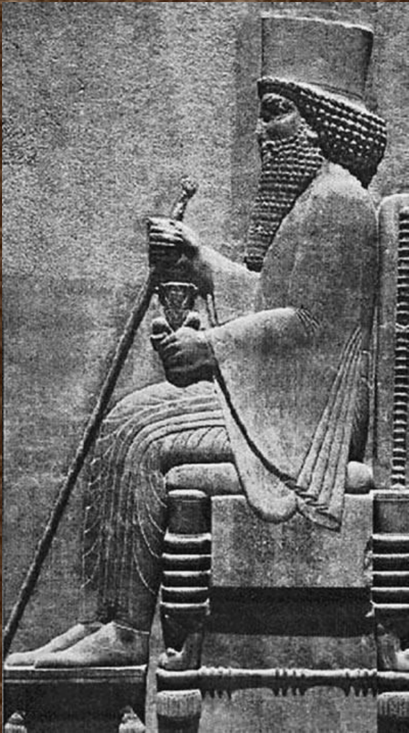
Статуя Дария I.

Самым могущественным правителем Персии был Дарий Первый. Окруживший себя тайными осведомителями, которые назывались «глаза и уши царя».