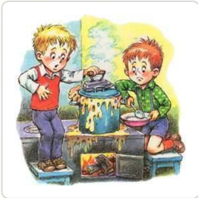
«Мишкин а каша»