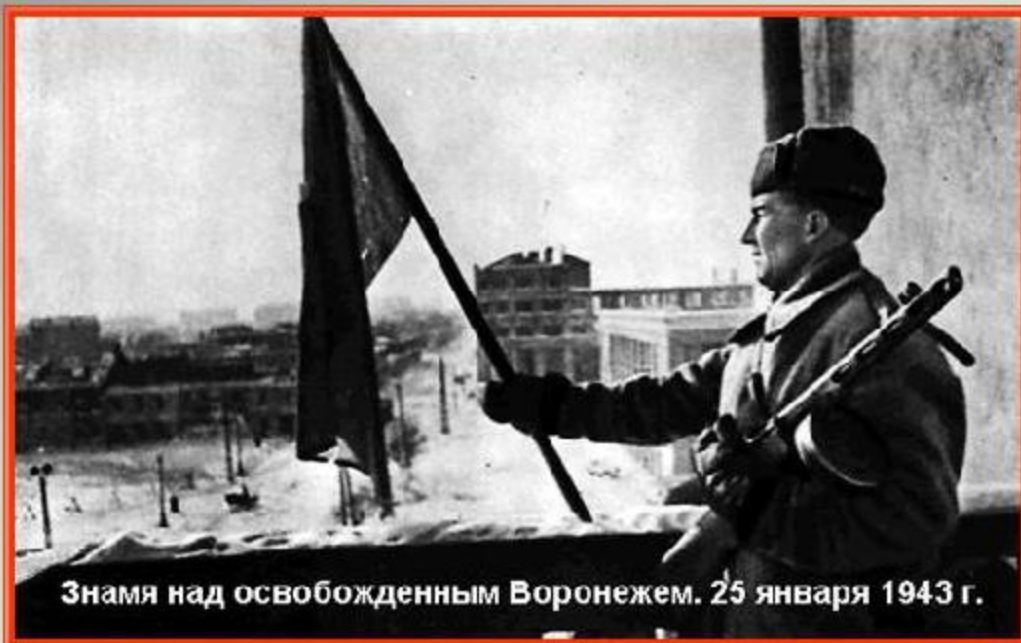
Знамя над освобожденным Воронежем. 25 января 1943 г.