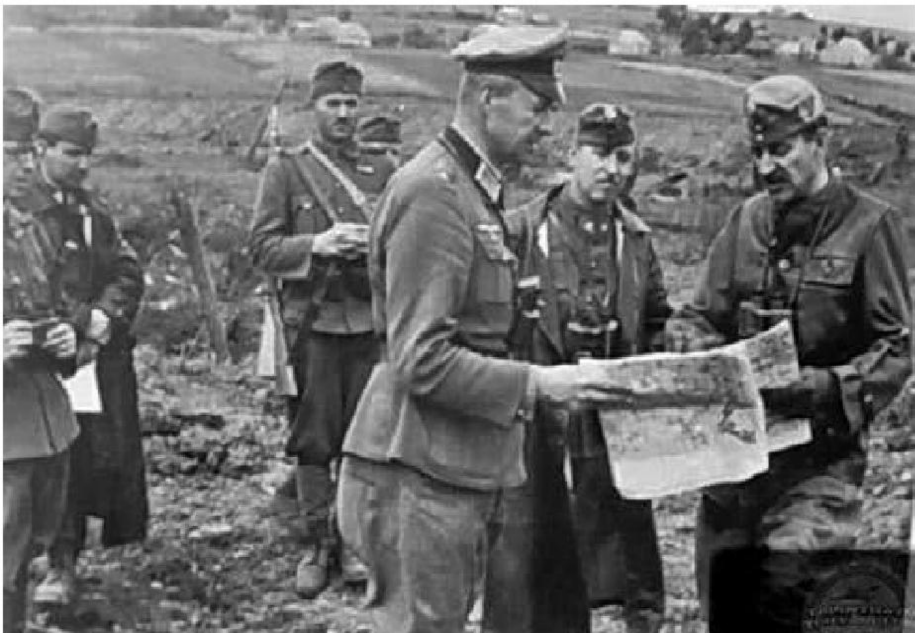
Немецкие и венгерские офицеры в районе Коротояка.