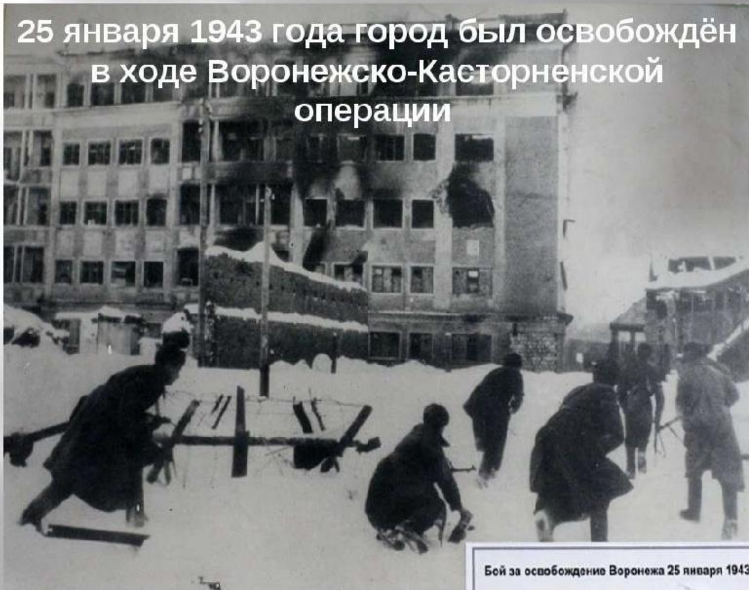
Бой за освобождение Воронежа 25 января 1943

25 января 1943 года город был освобождён в ходе Воронежско-Касторненской операции