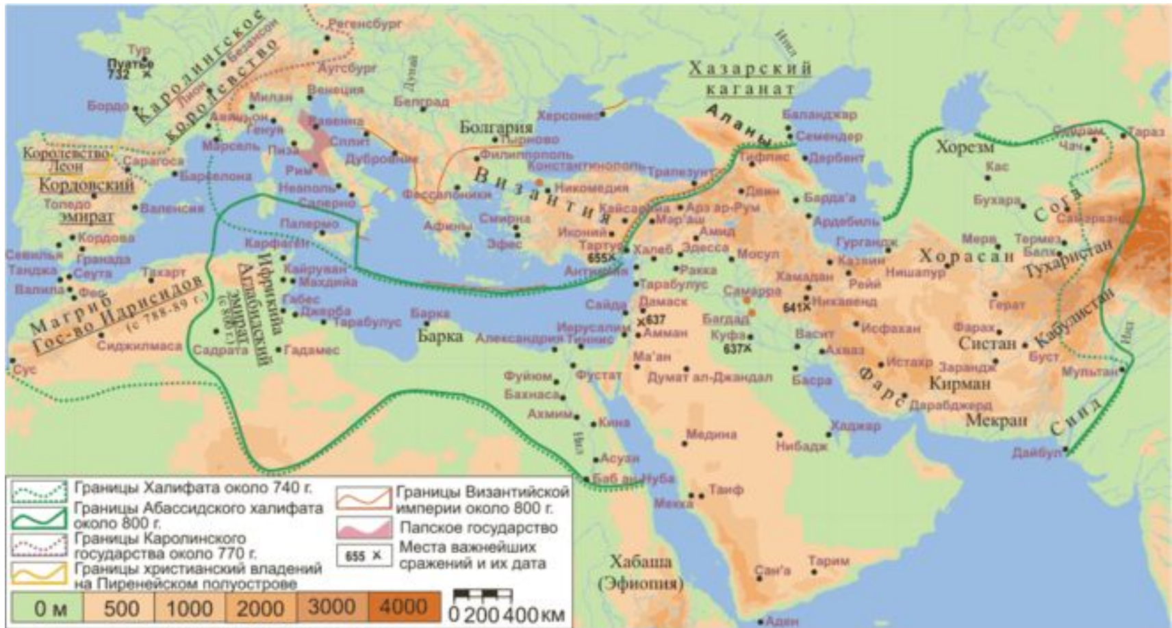
Map created for Gumilevica - A.Rodionov