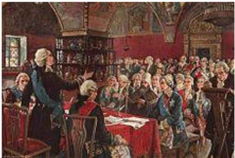
Матвей Зайцев. Екатерининская комиссия 1767 года