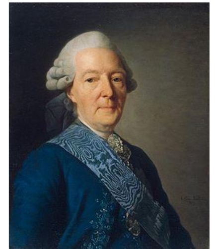
Иван Иванович Бецкой 1704 - 1795