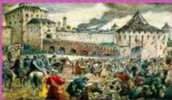
Э.Лиснер. Изгнание польских интервентов из Московского Кремля в 1612

26 октября (4 ноября) - освобождение страны от польских интервентов