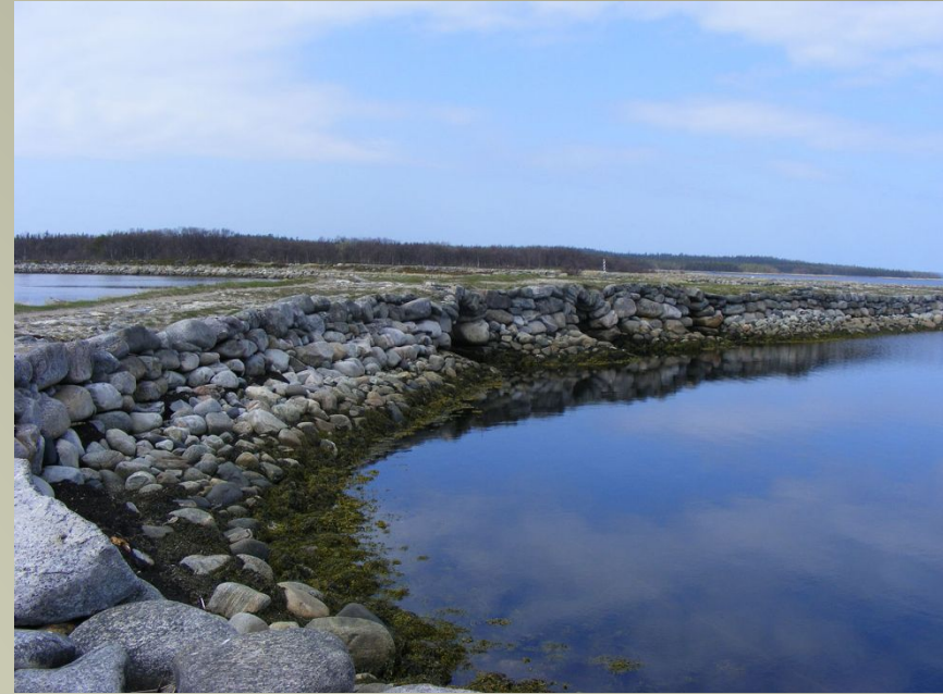
СОЛОВКИ — МІСЦЕ УВ'ЯЗНЕННЯ М. ЗЕРОВА

9 жовтня 1937 «справа Зерова та ін.» була переглянута особливою трійкою УНКВС по Ленінградській області. Засуджено до розстрілу. Зеров разом з багатьма іншими представниками української культури був розстріляний в селищі Сандармох 3 листопада 1937 року.