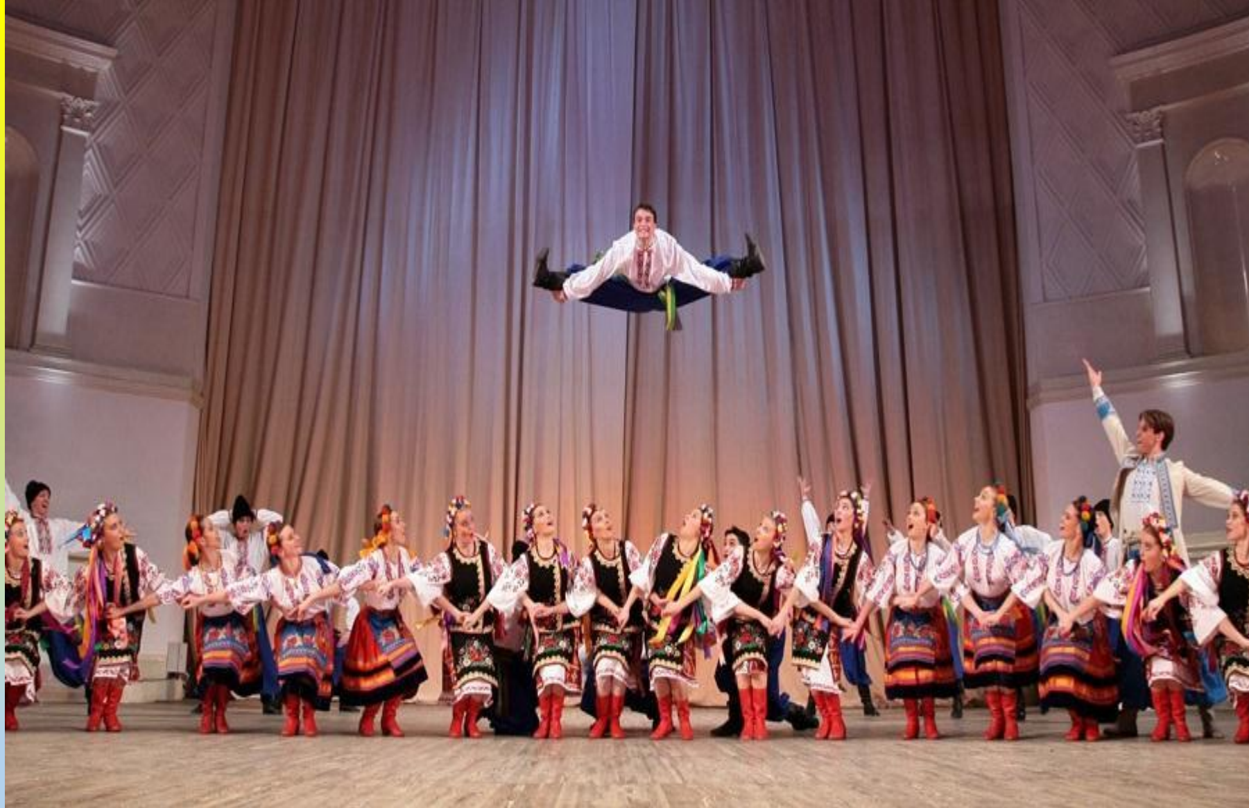
Український танець «Гопак»