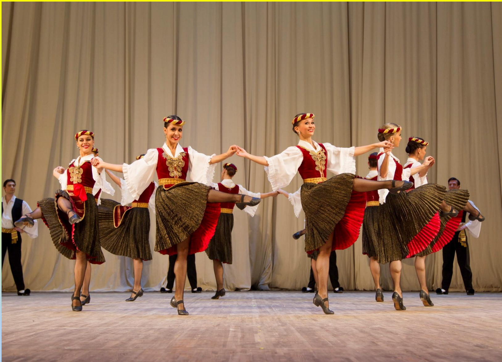
Греческая сюита (несколько разнохарактерных греческих танцев в