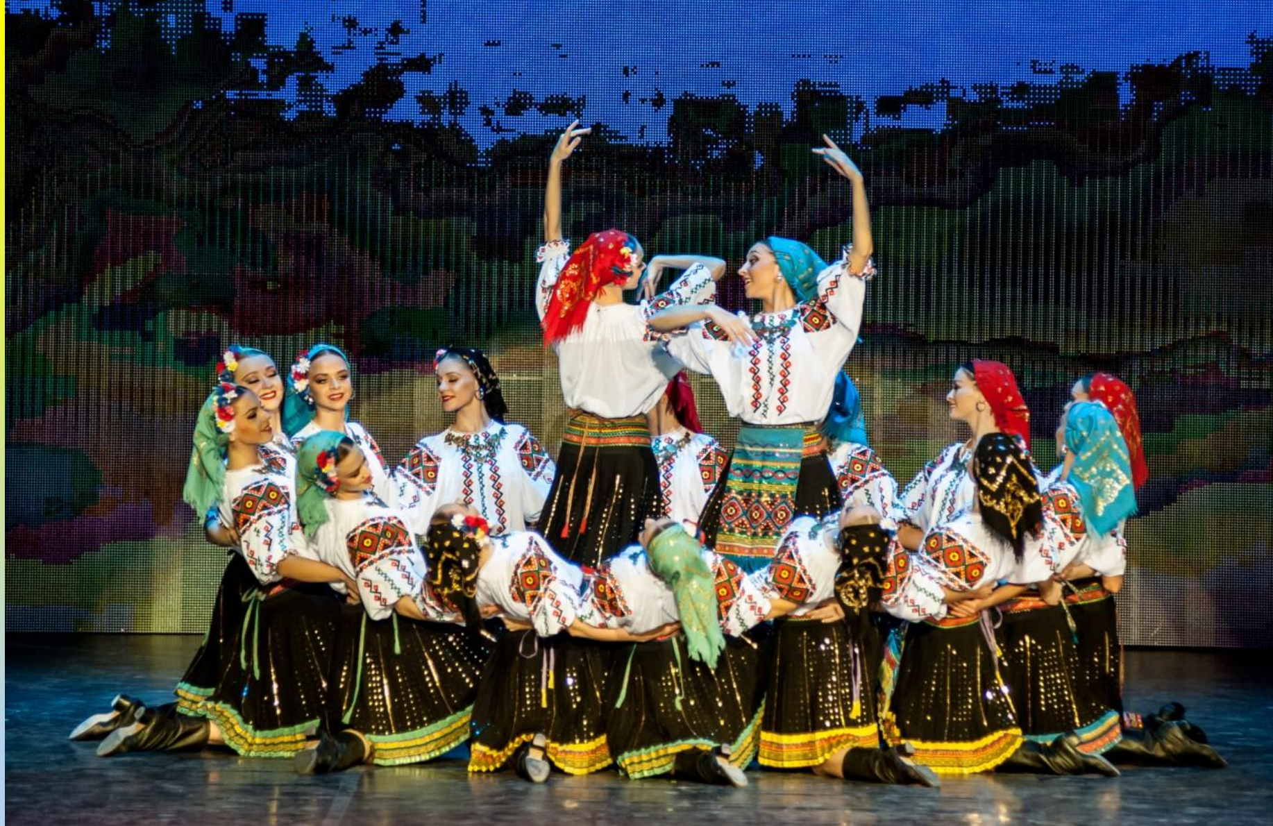
Молдавская сюита (несколько разнохарактерных молдавских танцев в одной композиции)