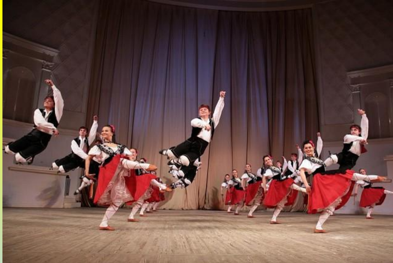
Испанский танец «Арагонская хота»