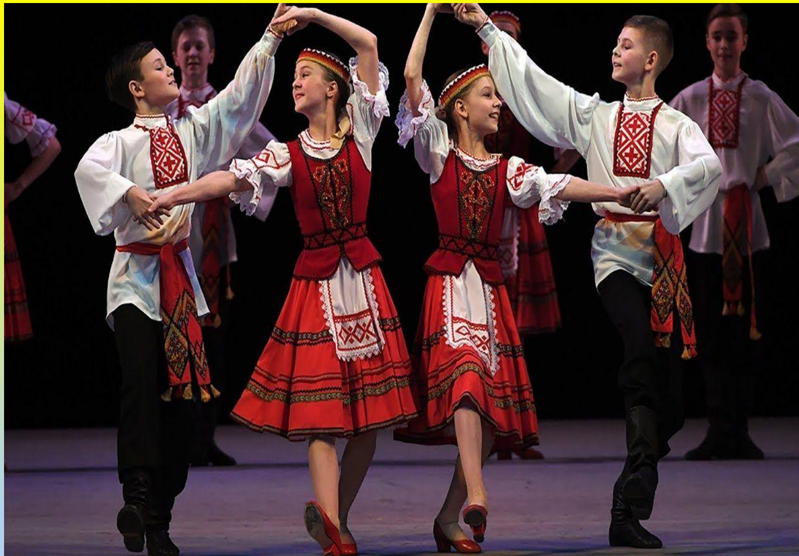
Белорусский танец «Крыжачок»

В 1943 году под руководством Игоря Моисеева была создана первая в стране профессиональная школа народного танца (хореографическая Школа-студия при Государственном академическом ансамбле народного танца).