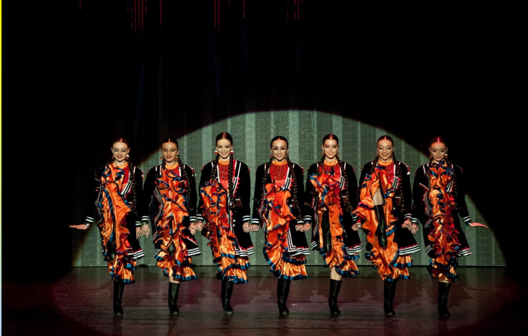
Башкирский танец «Семь красавиц»