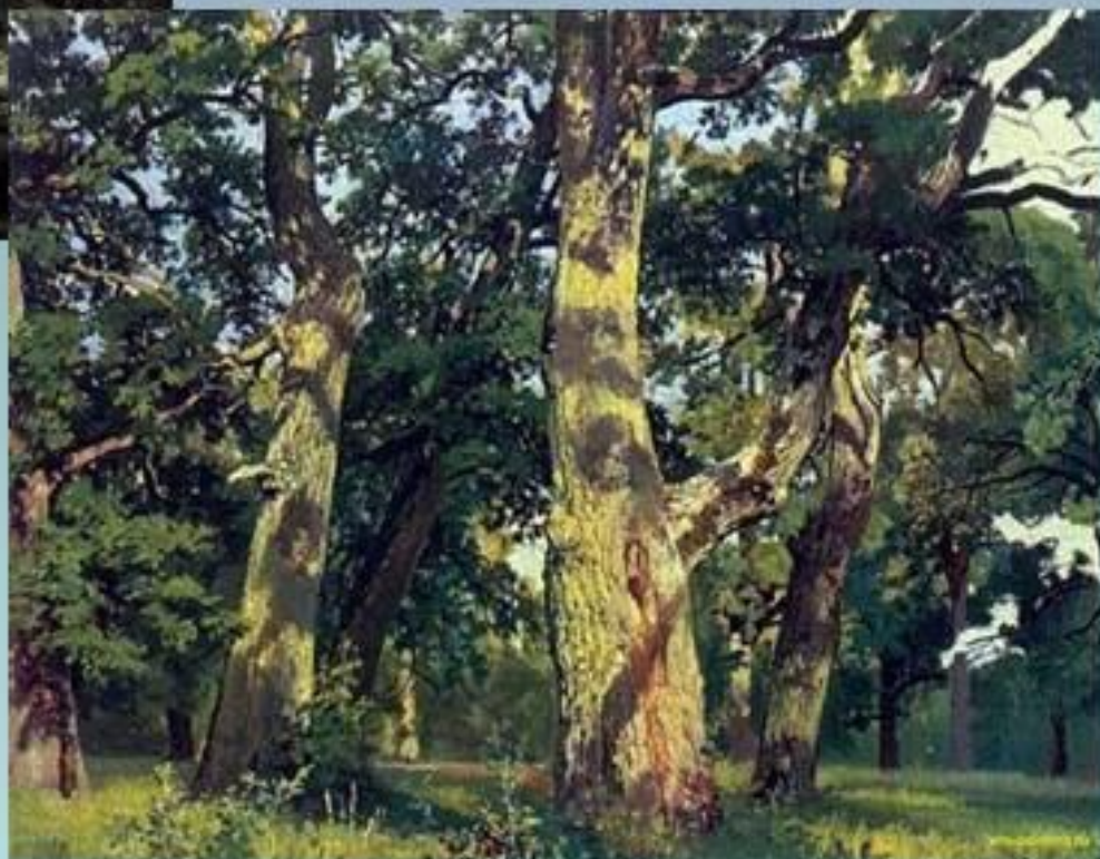
И.Шишкин. Дубы. Вечер