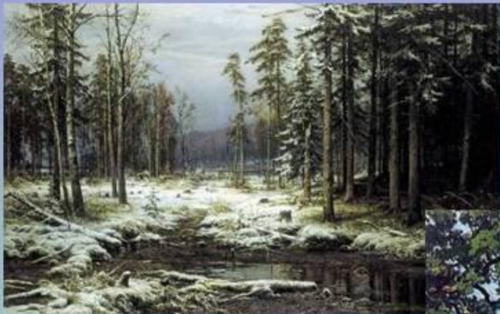
И.Шишкин Первый снег