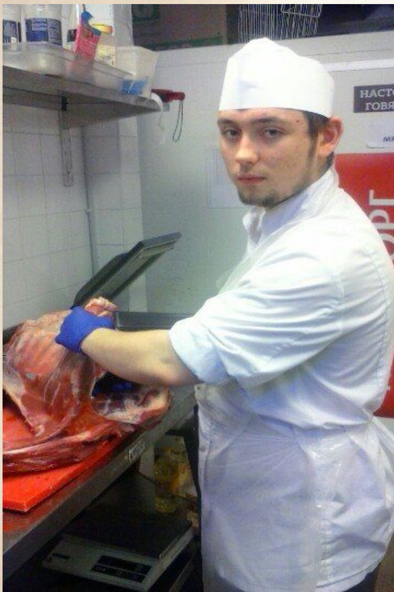
"Sokos "Palace Bridge""