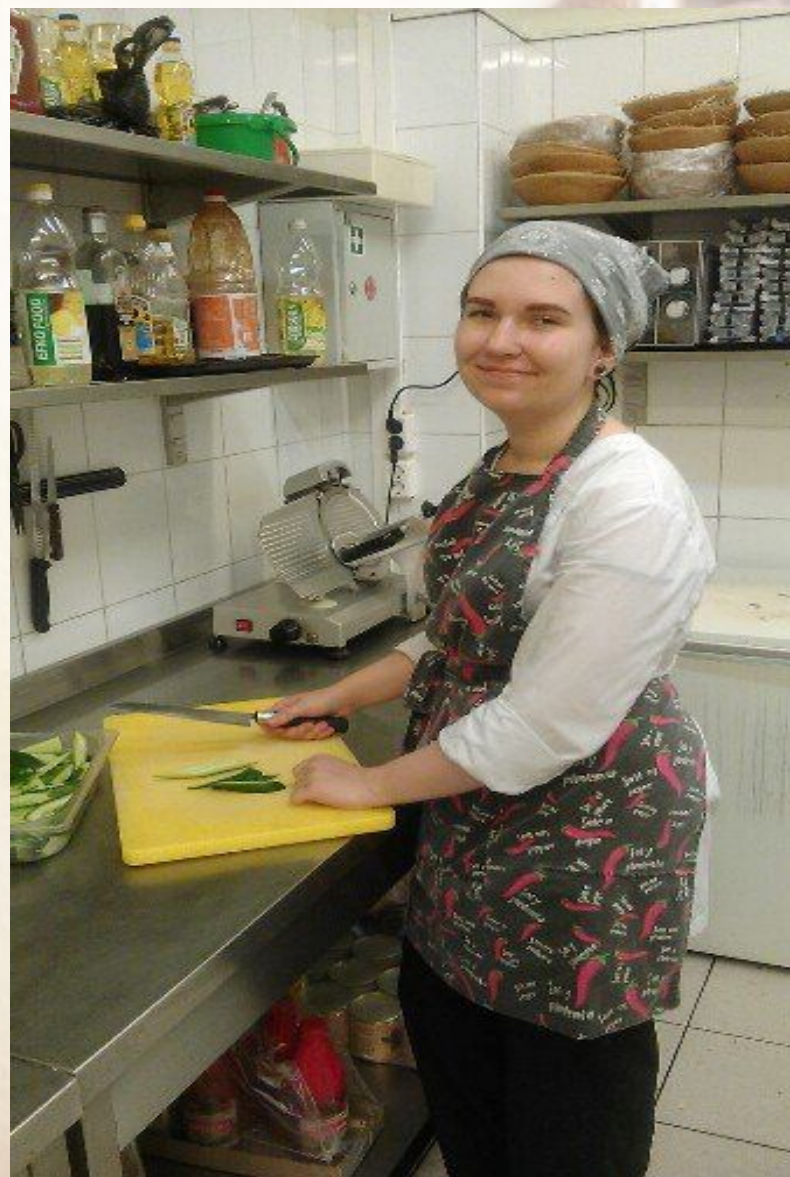
Гостиница «Октябрьская» ресторан «Ассамблея»