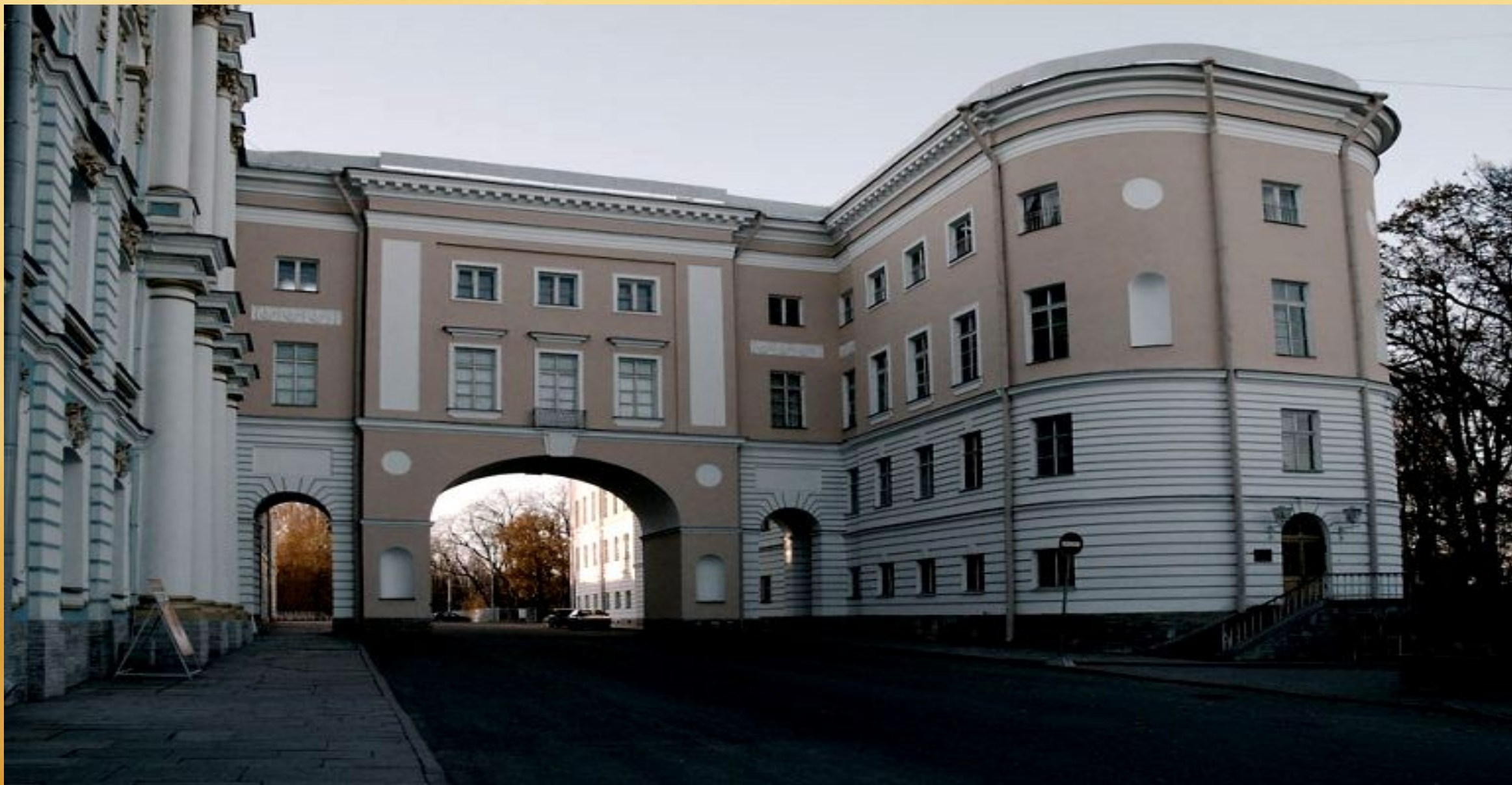
Царскосельский лицей в наши дни