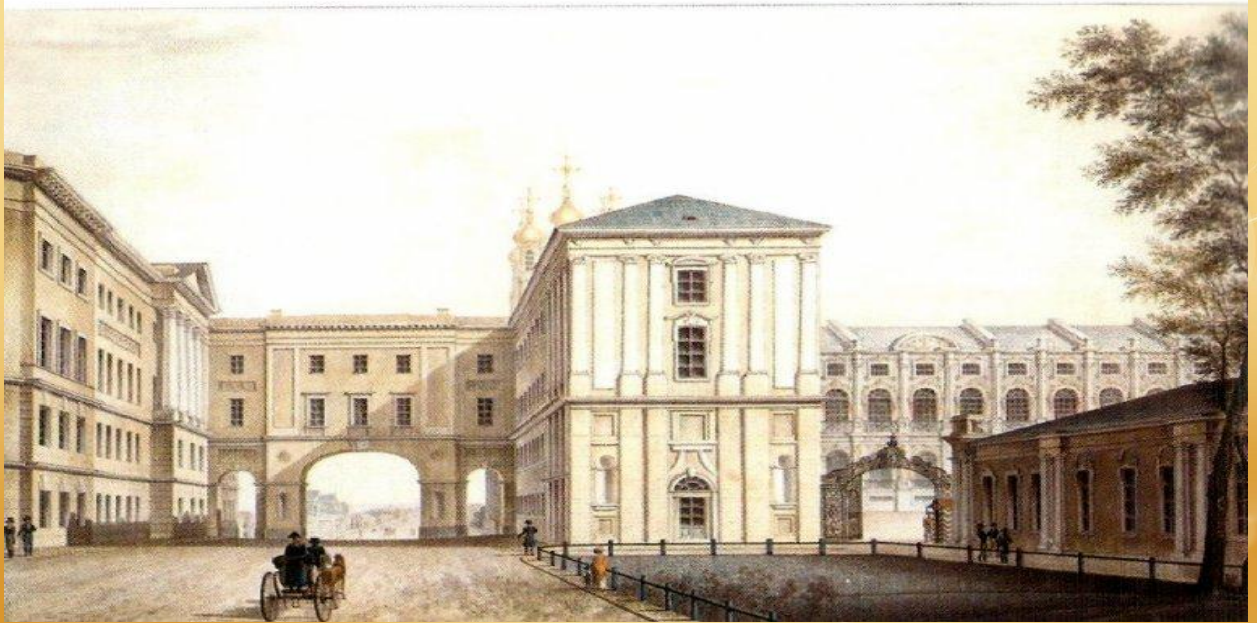
Царскосельский лицей во времена Пушкина