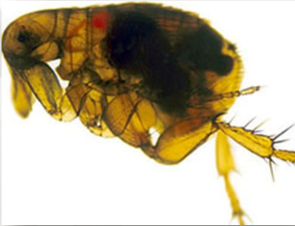
Блоха заражённая бактериями чумы (темные тятна)