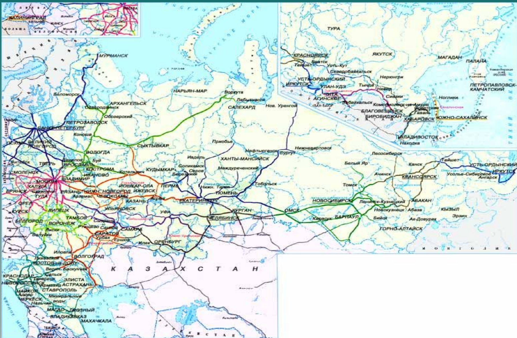
Схема сети железных дорог РФ (цветом выделены отдельные железные дороги)