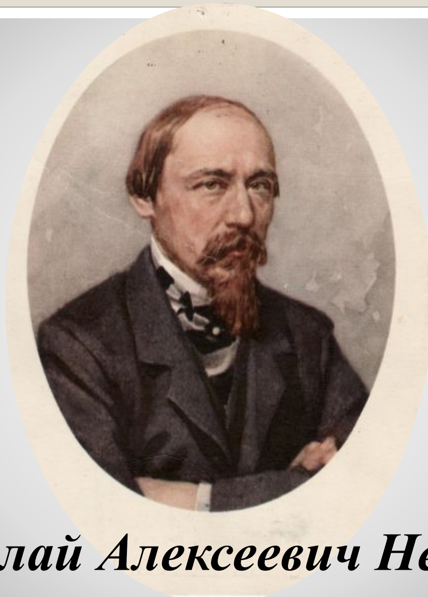
Николай Алексеевич Некрасов (1821-1878)