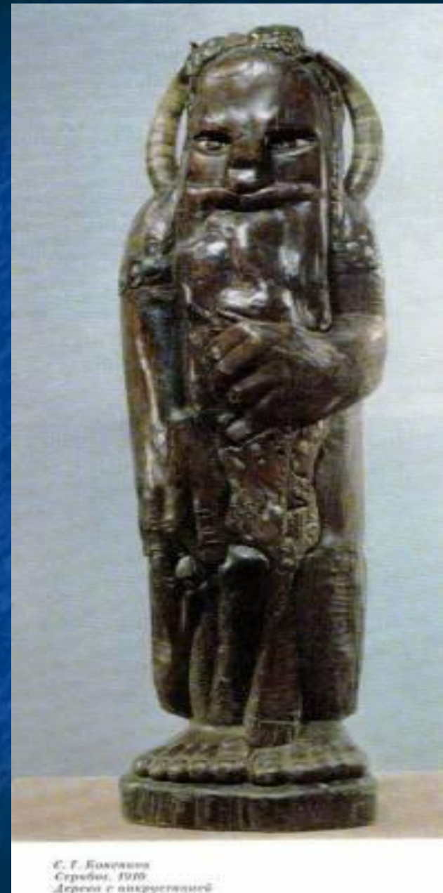
С. С. Коненков Стрибог, 1910 Дерево с окраской

Коненков С. Стрибог. Дерево. Начало 20 в.