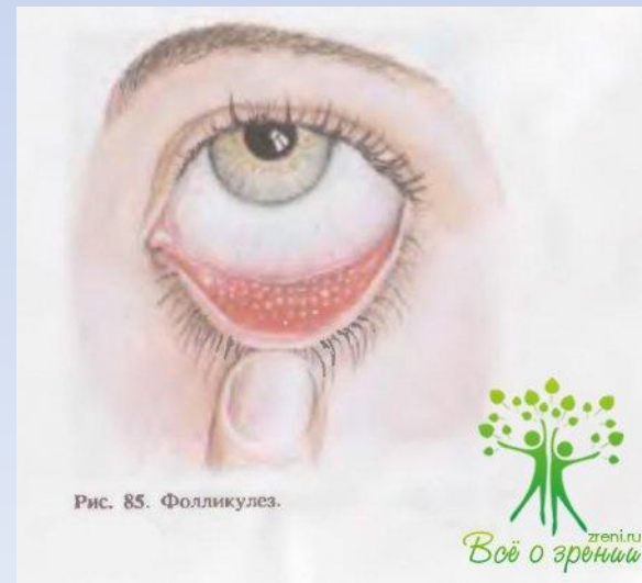
Рис. 85. Фолликула.