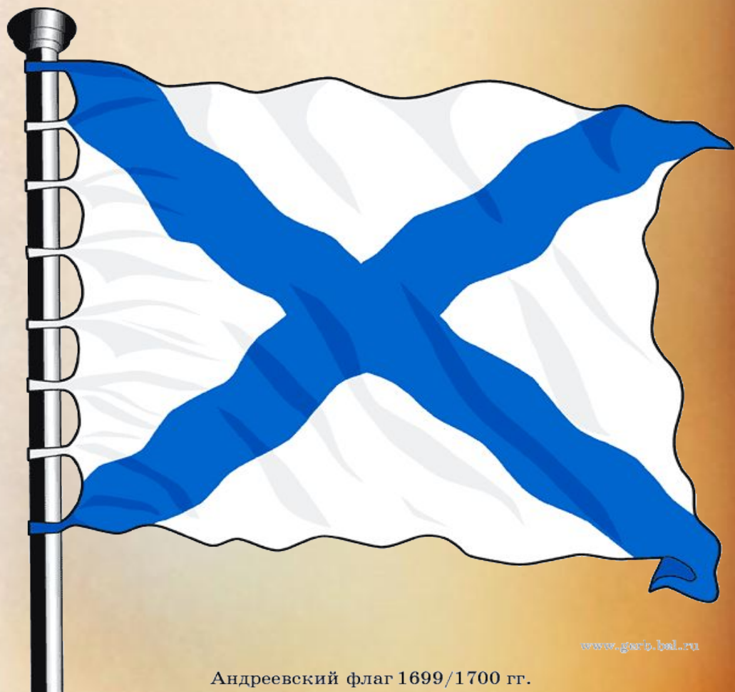
Андреевский флаг 1699/1700 гг.