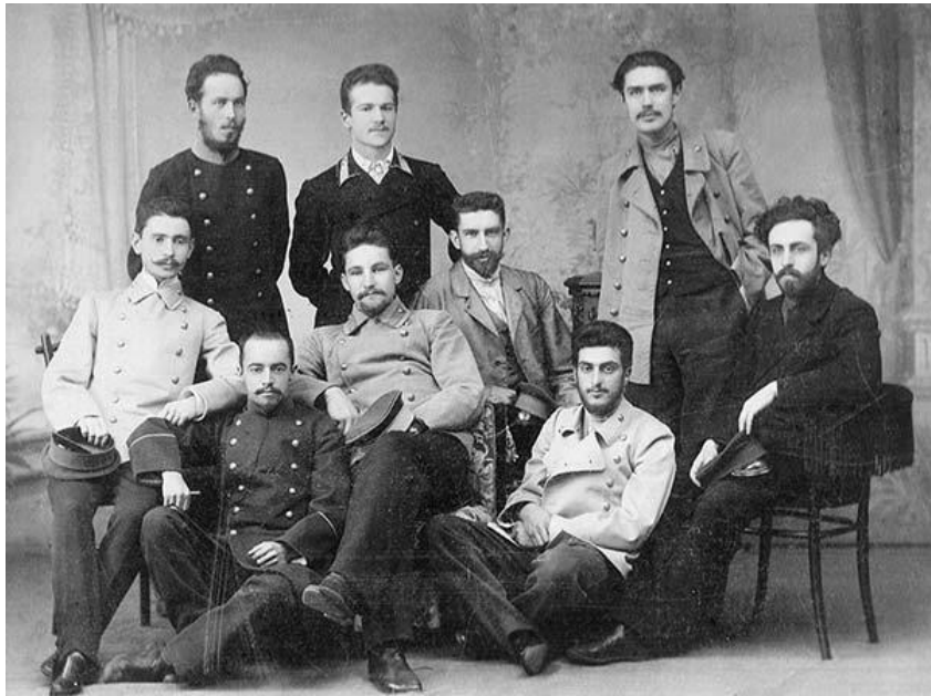
Студенты и преподаватели Императорского Санкт-Петербургского университета 1903г.

Руководство считало такое устройство весьма полезным: студенты подавали младшим пример, «поддерживая на высоте свое звание, а кроме того, приобретали педагогический опыт».