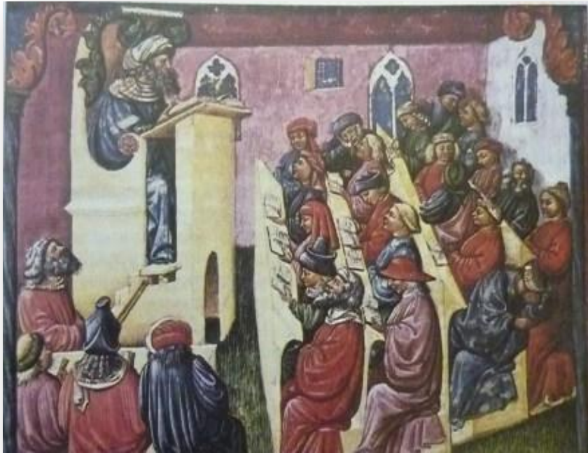
Лекция в университете (миниатюра из книги Liber Ethicorum, 2-я пол. XIV в.)

В XI-XII вв. в Европе открываются первые университеты. Студенты и профессора объединяются в университеты для того, чтобы добиться независимости от города, иметь право самоуправления.