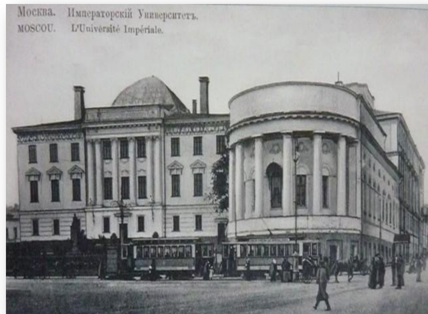
Церковь св. Татьяны при Московском университете и часть университетского здания. Открытка «Шерер, Набгольц и К», 1914г.

Церемония торжественного открытия занятий в университете состоялась в день празднования годовщины коронации Елизаветы Петровны 26 апреля (7 мая) 1755 года. С тех пор эти дни традиционно отмечаются в университете студенческими празднованиями, к ним приурочены ежегодная научная конференция «Ломоносовские чтения» и дни научного творчества студентов. В семье Шуваловых это был день Ангела матушки Ивана Ивановича. В первые годы в университете числилось 100 студентов, в конце 1890-х - 4147. Университет имел свою церковь, названную во имя мученицы Татьяны.