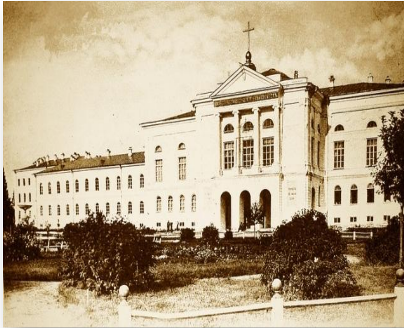
Томскъ. Первый университет в Сибири

Где жили студенты императорских университетов, чему учились, как протекала их студенческая жизнь - эти и многие другие вопросы изучила группа российских ученых.