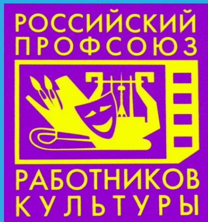
Российский профсоюз работников культуры