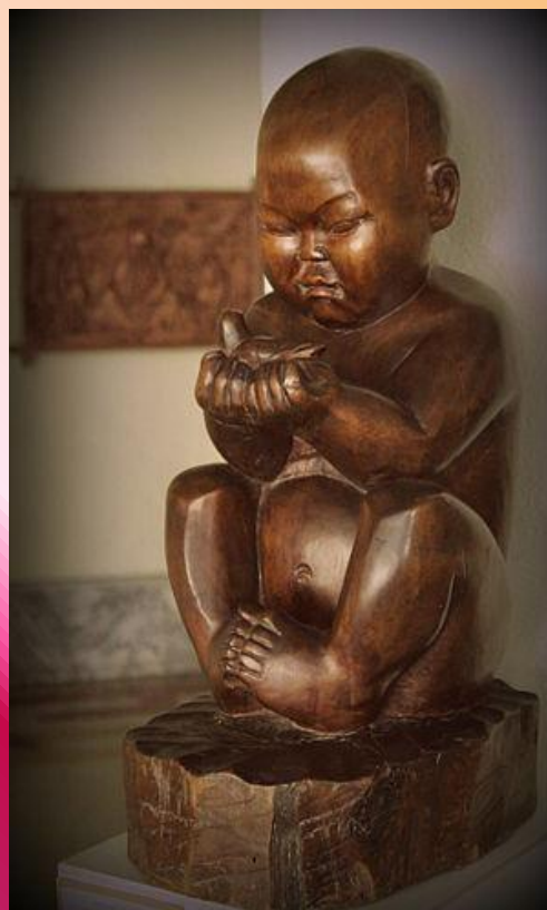
Мальчик с птичкой. Художественный музей им. Ц. С. Сампилова

• Генна́дий Гео́ргиевич Васи́льев (1940—2012) — советский и российский скульптор . Заслуженный художник РСФСР (1985). Народный художник Бурятской АССР (1979). Член-корреспондент Российской академии художеств (1988), академик РАХ (2007), заслуженный деятель искусств Бурятской АССР (1973), лауреат премии Ленинского комсомола Бурятской АССР, Лауреат Государственной премии Бурятской АССР в области литературы и искусства (1983).