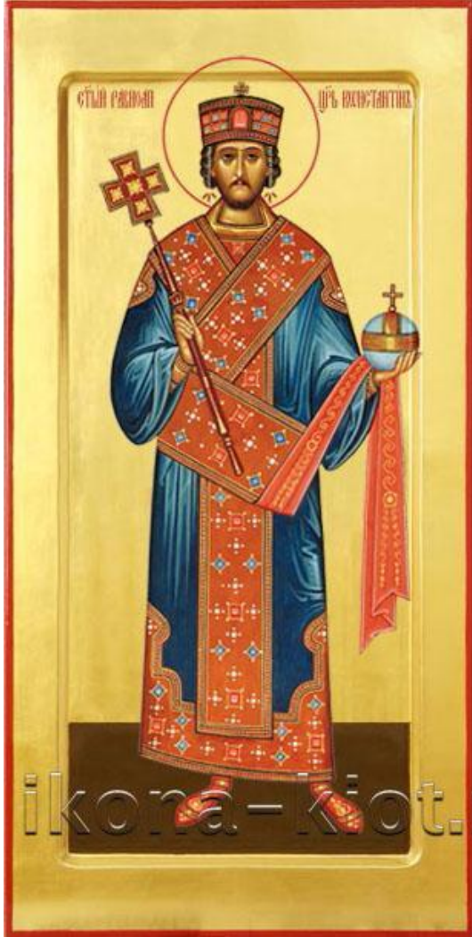
Равноапостольный Константин Великий