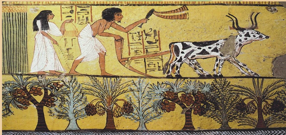
земледелие и скотоводство

Исходный пункт нового этапа - возникновение и развитие земледелия и скотоводства. Осуществляется переход от присваивающей к производящей экономике. Человек начинает активно вмешиваться в природу. Вырубаются леса, строятся ирригационные системы. Человеческая деятельность начинает оказывать разрушительное воздействие на природу. Засоление почв в долине Тигра и Ефрата явилось результатом ирригационных работ. Однако разрушение носит локальный характер и зачастую приводит к исчезновению самих цивилизаций - зависимость от природных условий жизни людей очень велика. Природа остается грозной силой, превосходящей человека практически во всем, но вызывает она уже не ужас, а восхищение. В античной философии природа - идеал гармонии, совершенства и красоты. Космос, включает в себя и природу, и богов и людей, и далекие звезды. Законы Космоса и природы совершенны. Человек (а он далеко не совершенен) должен жить в согласии с природой и по ее законам, если хочет добиться такой же гармонии в себе.