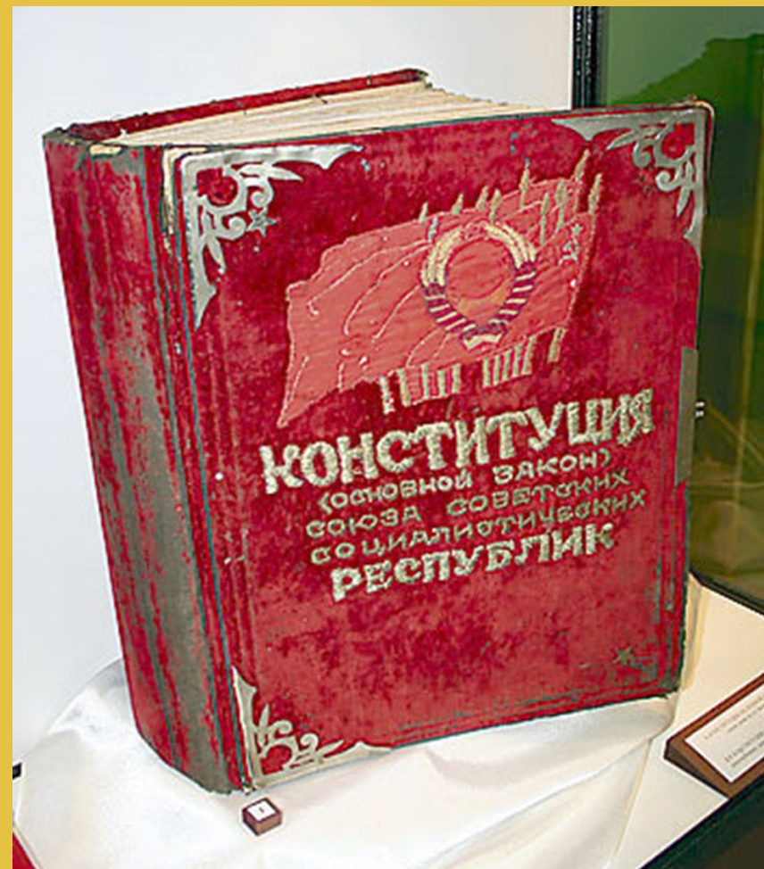
Главная Конституция СССР