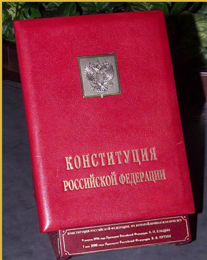
Экземпляр №1 конституции РФ

День Конституции — празднование принятия Конституции в современной России, отмечается 12 декабря.