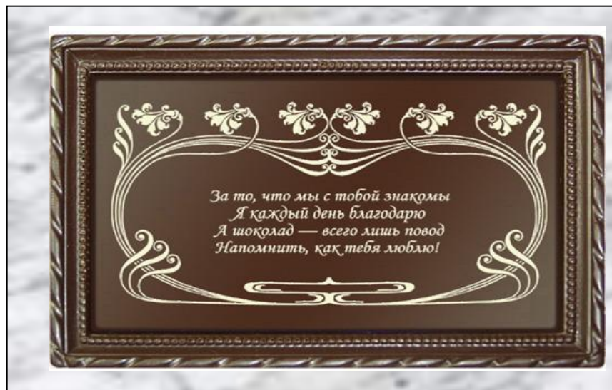
Открытки из шоколада