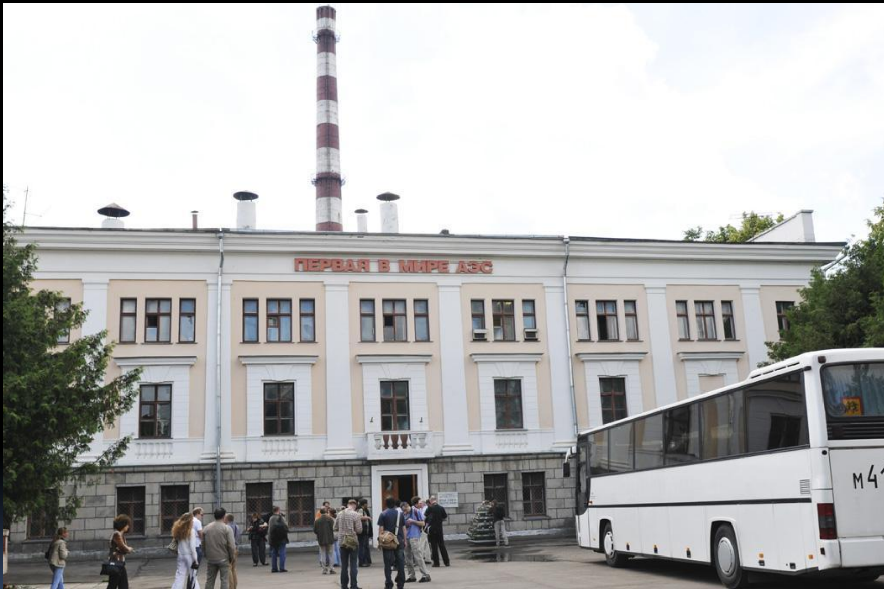
Первая в мире АЭС (г.Обнинск)