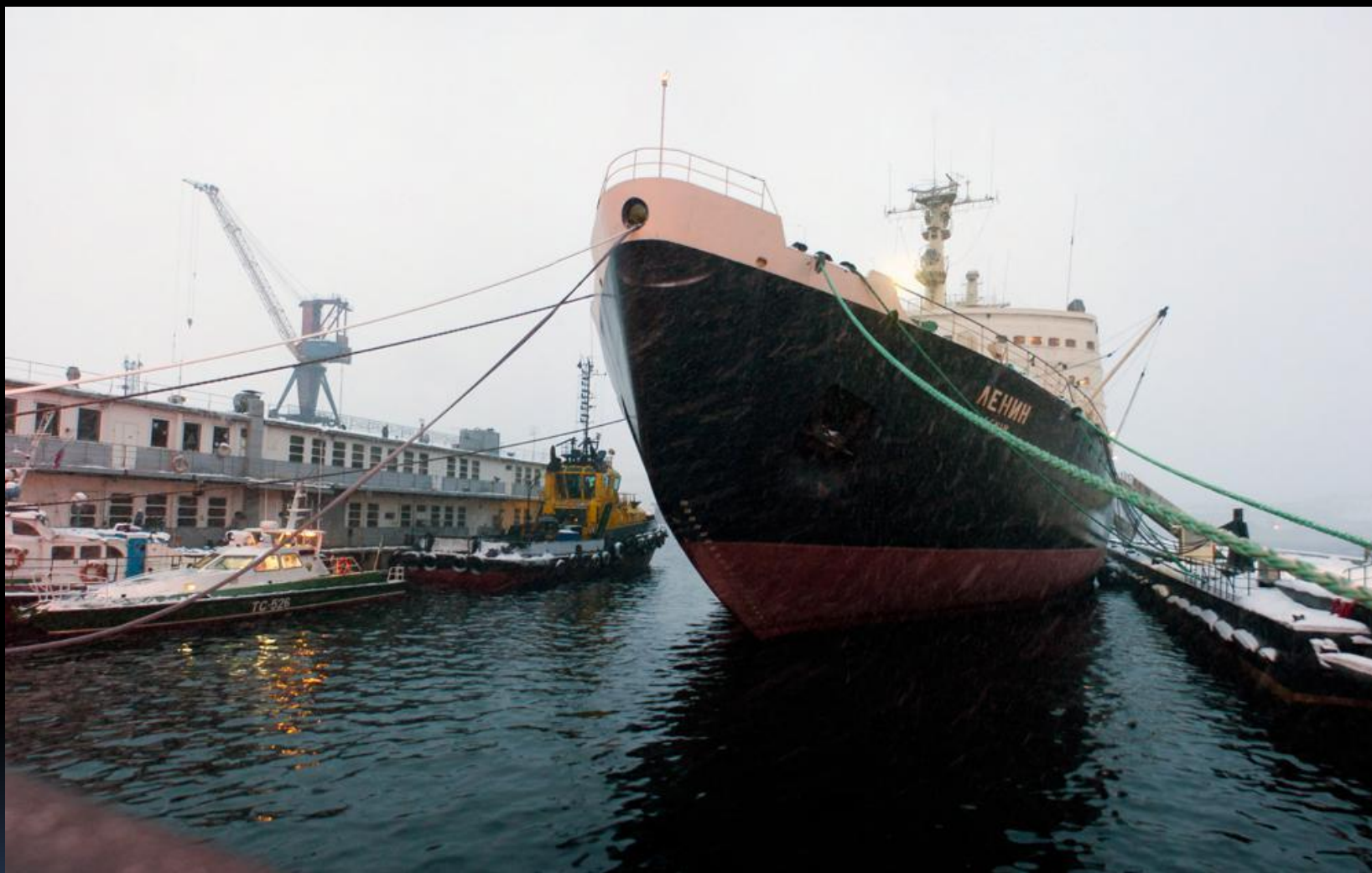
Атомное судно – ледокол “Ленин”.