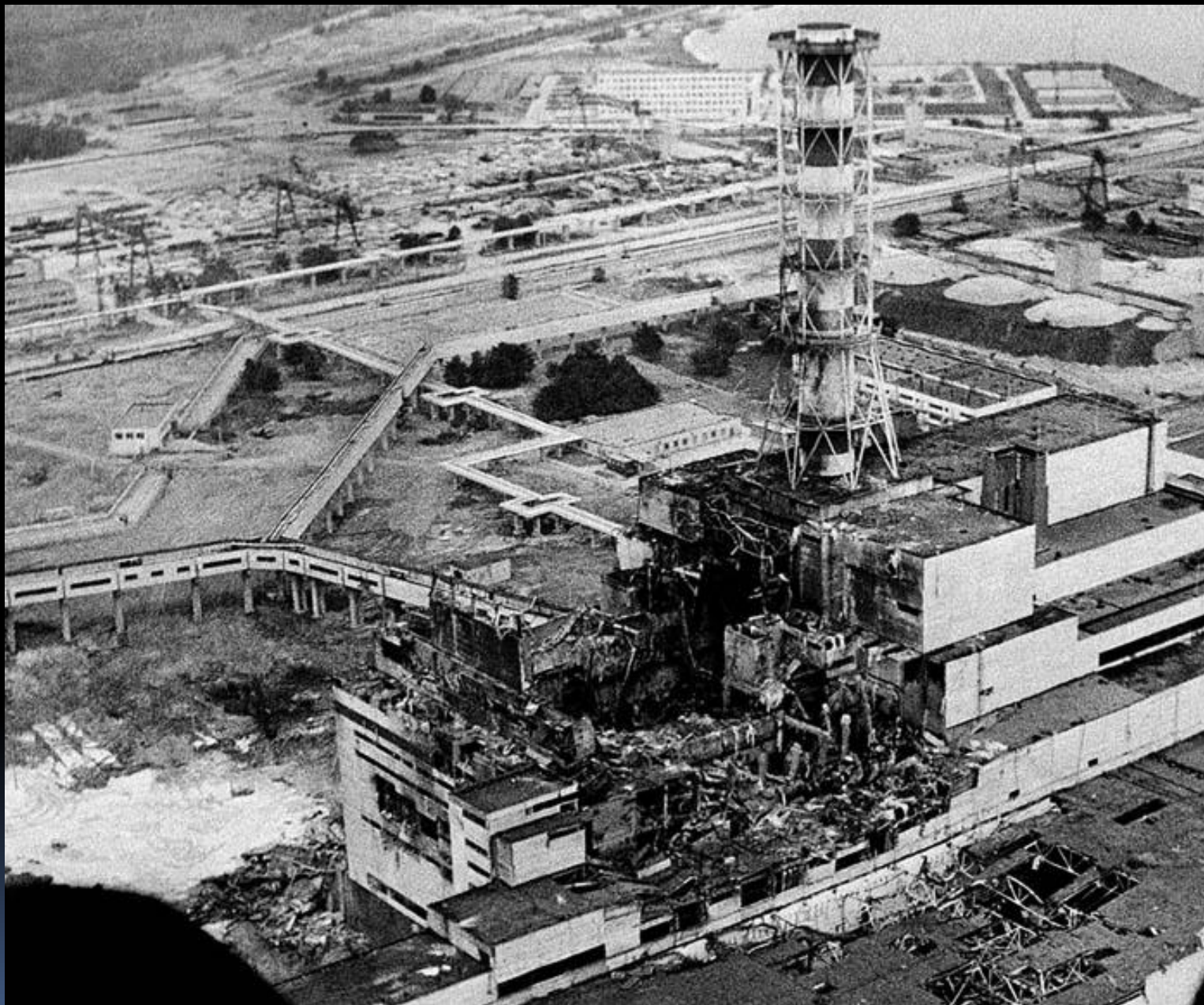
Авария на Чернобыльской АЭС