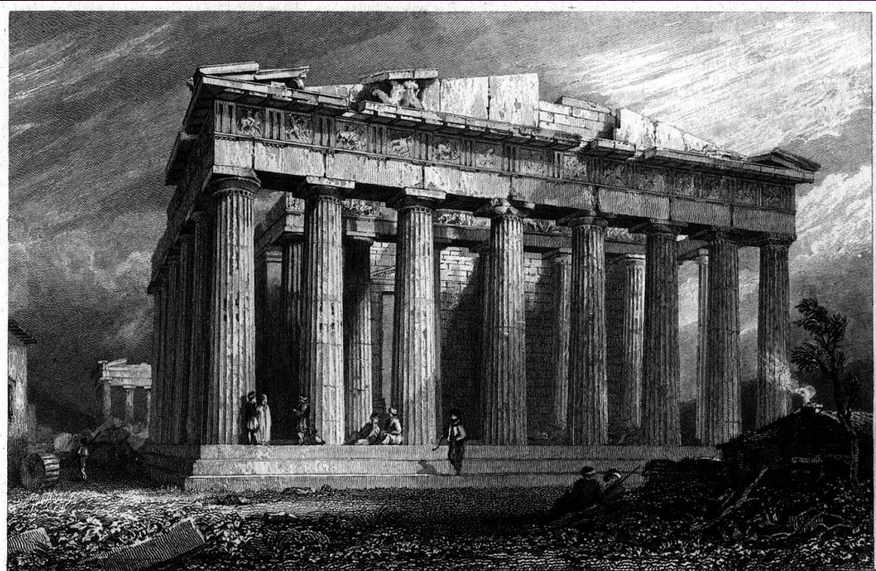
PARTHENON OF ATHENS, IN ITS PRESENT STATE.