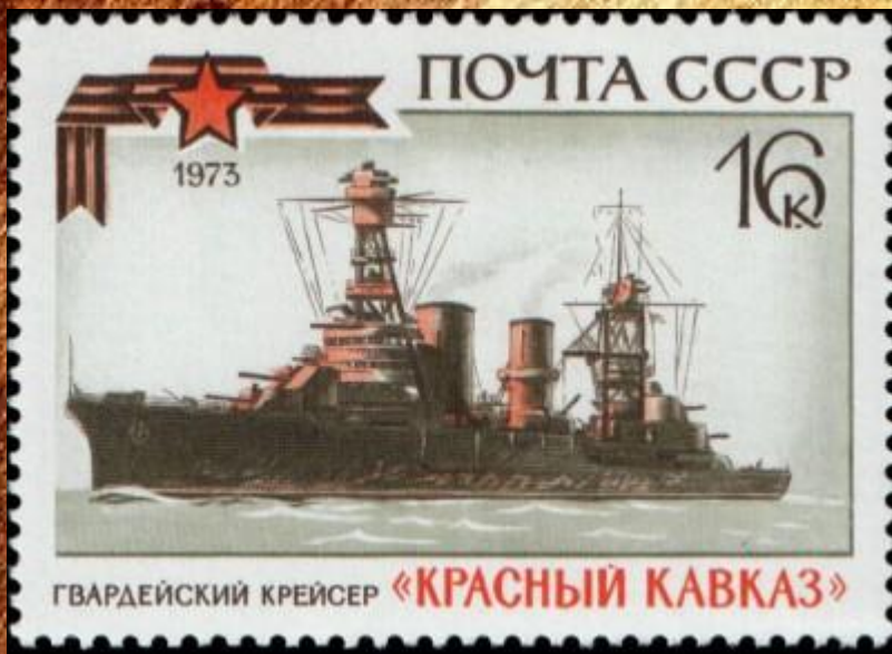
Гвардейская лента на марке почты СССР