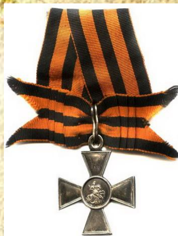
ГК 3 ст. с бантом.

В 1807 году император Александр I учредил специальную награду для нижних чинов Русской Армии за личную храбрость в бою, которая получила название - Знак отличия Военного ордена. Ношение креста предписывалось на ленте, цвета которой соответствовали цветам ордена Св. Георгия. Именно с этого периода популярность Георгиевской ленточки становится всенародной, так как подобные награды простой российский народ видел гораздо чаще, чем золотые ордена офицерского состава Российской Армии. Этот знак в дальнейшем получил название солдатский Георгиевский крест или солдатский Георгий (Егорий), как его называли в народе.