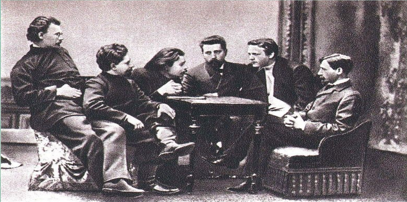
С. Г. Скиталец, Л. Н. Андреев, А. М. Горький, Н. Д. Телешов, Ф. И. Шаляпин, И. А. Бунин 1902 г.