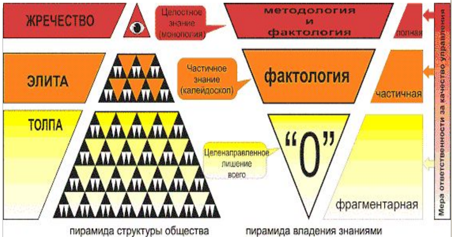
Схема устройства толпо-элитарного общества