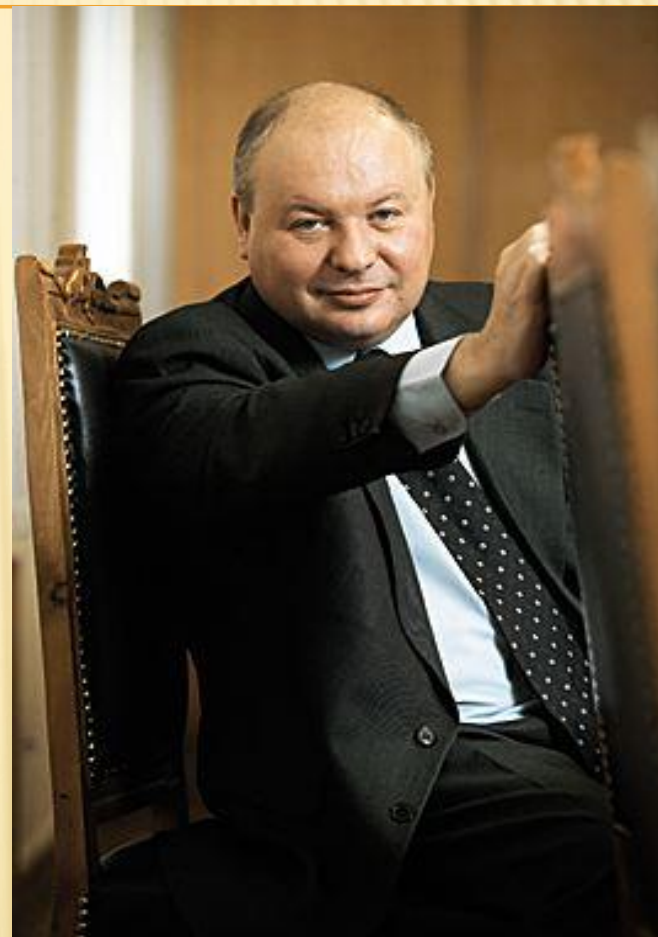
Егор Тимурович Гайдар, вице-премьер Правительства РСФСР

Цены выросли сразу в 10-12 раз , к концу 1992 г. - в среднем в 25 раз .