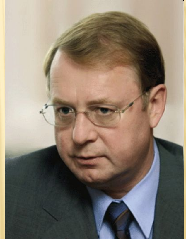
Сергей Вадимович Степашин, Премьер-министр