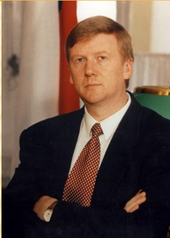
Анатолий Борисович Чубайс

Формирование слоя собственников – важная задача экономической реформы