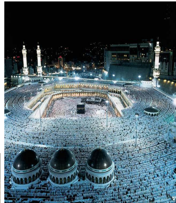
Ислам возник в 7в.