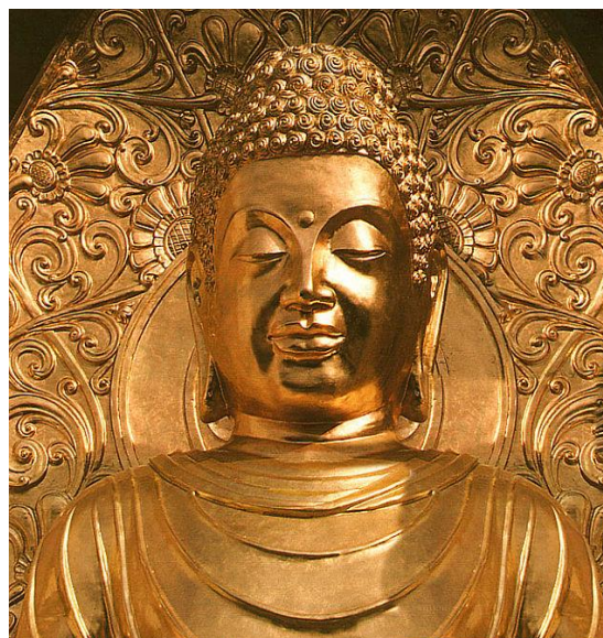
Буддизм возник в VI-V в. до н.э.