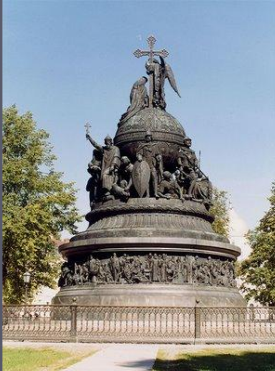
Микешин «Тысячелетие России»