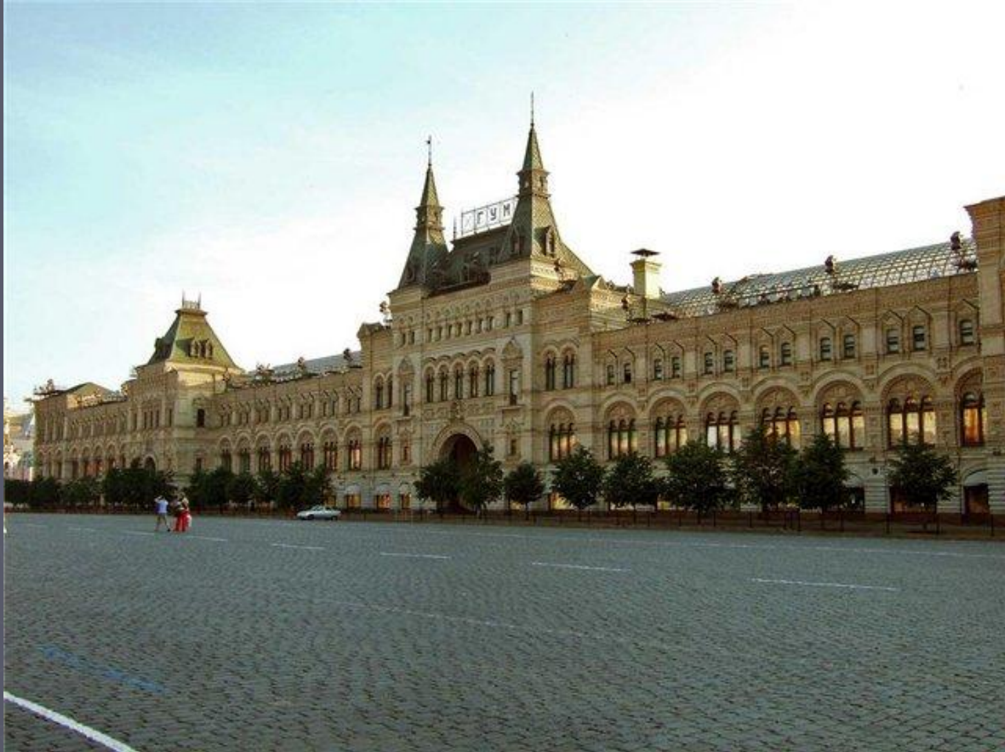
А.Померанцев Верхние торговые ряды (здание ГУМа)