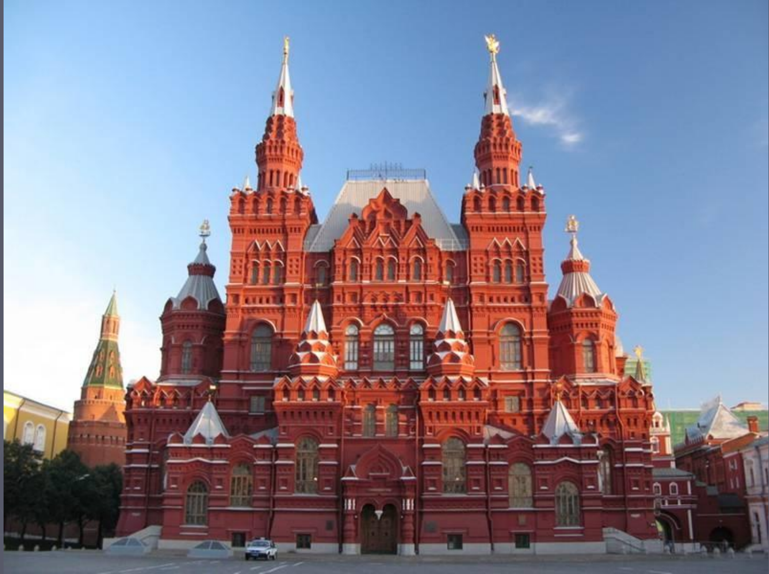
А.Семенов, В.Шервуд Здание исторического музея