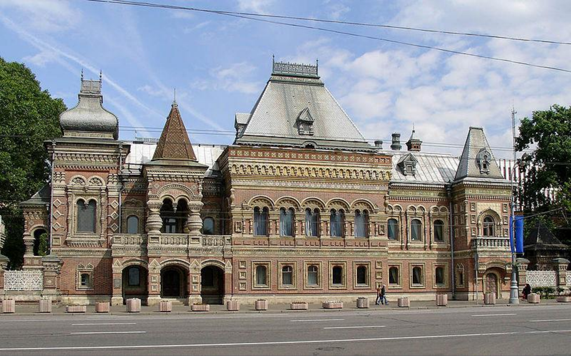
Дом Игумнова Арх. Поздеев