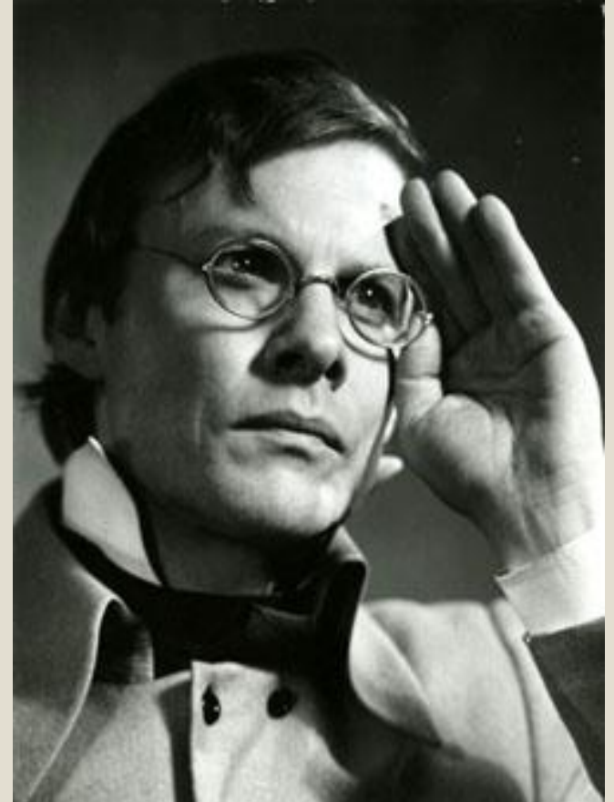
В. Соломин в роли Чацкого