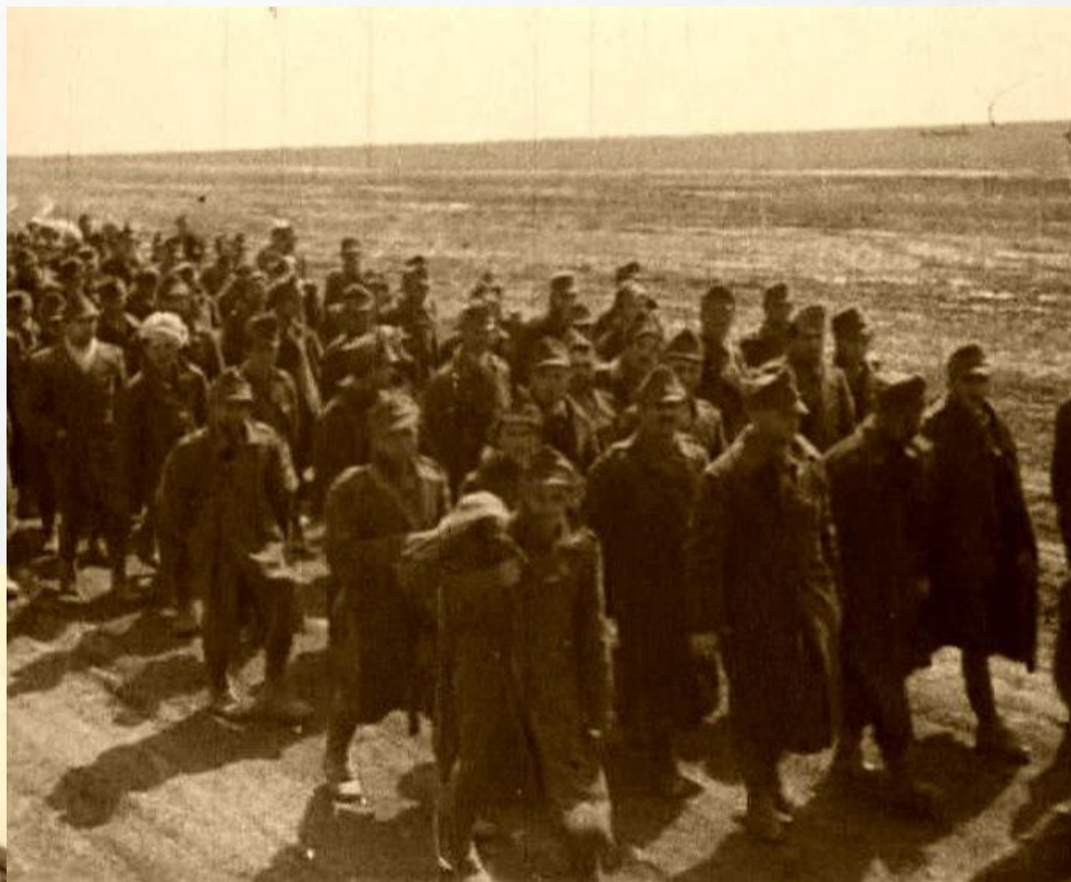
Пленные немецких и румынских частей

Брошенный немцами на ст. Джанкой паровоз и состав с техникой и боеприпасами