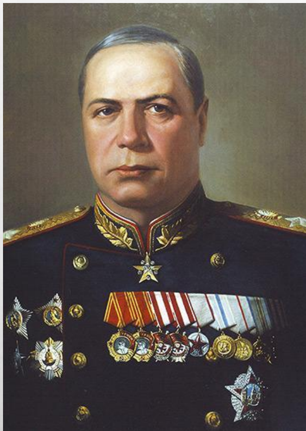
ГЕНЕРАЛ АРМИИ ТОЛБУХИН ФЁДОР ИВАНОВИЧ