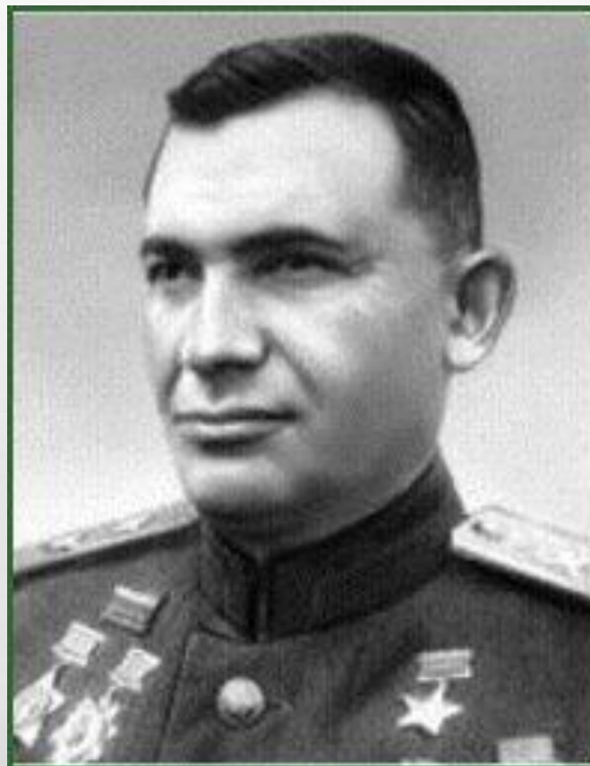
ГЕНЕРАЛ-ЛЕЙТЕНАНТ КРЕЙЗЕР ЯКОВ ГРИГОРЬЕВИЧ