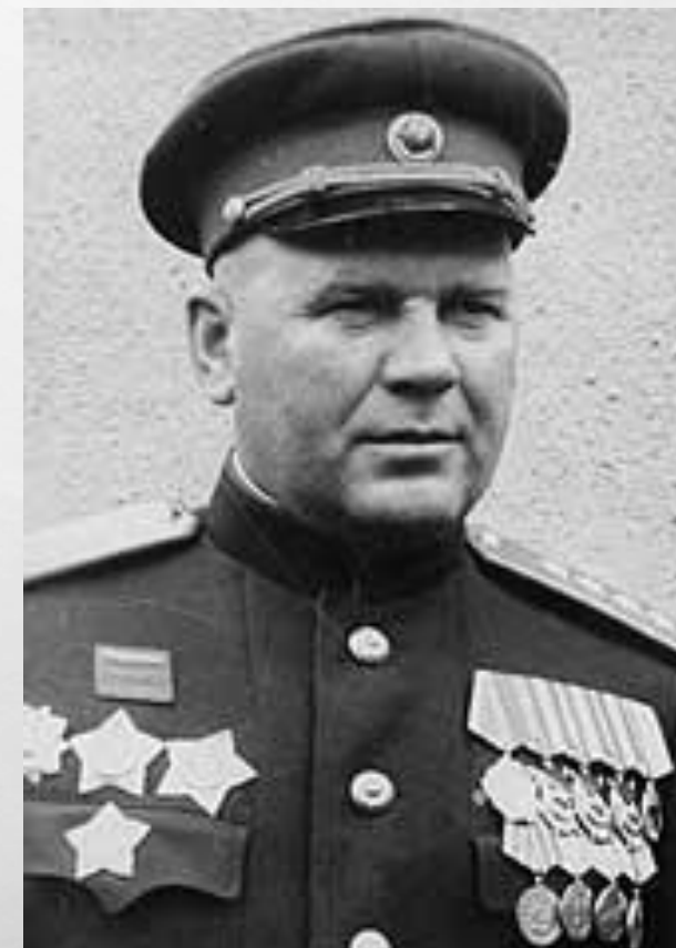
ГЕНЕРАЛ -ЛЕЙТЕНАНТ ЗАХАРОВ ГЕОРГИЙ ФЁДОРОВИЧ