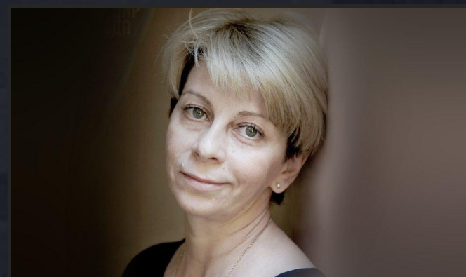
Елизавета Петровна Глинка (Доктор Лиза)

Доброта не позволит пройти мимо чужой боли, чужой беды. Вспомним, сколько сделала доктор Лиза, так ее называют на Донбассе, для маленьких больных детей. Сотни малышей вывезены из опасных районов и размещены в лучшие клиники страны. Разве доктор Лиза не добрый человек?!