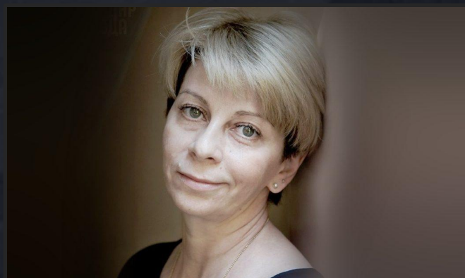
Елизавета Петровна Глинка (Доктор Лиза)

Одним из примеров проявления человеческой мечты является Доктор Лиза. Она всегда старалась помочь нуждающимся, несмотря ни на что. В этом заключалась её мечта.