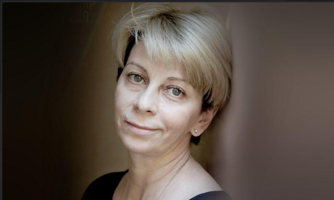
Елизавета Петровна Глинка (Доктор Лиза)