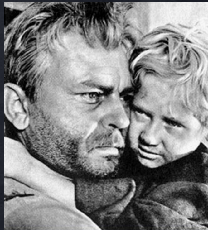
Андрей Соколов (Шолохов «Судьба человека»)

В качестве аргумента можно взять рассказ М. Шолохова «Судьба человека». Главный герой пытается сбежать из концентрационного лагеря. Таким образом, он показывает свое стремление к свободе и независимости.