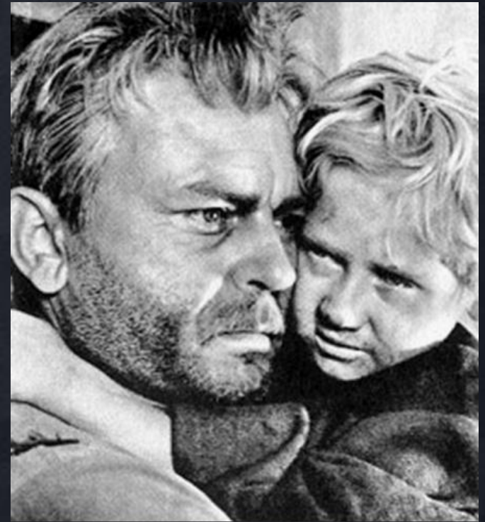
Андрей Соколов (Шолохов «Судьба человека»)

В рассказе М. Шолохова «Судьба человека» получили развитие идеи великой ненависти мирных советских людей к войне, к фашистам «за все то, что причинили они Родине». Автор показывает красоту души и силу характера русского человека, который жертвует жизнью ради Отечества.