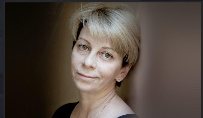
Елизавета Петровна Глинка (Доктор Лиза)

Примером отзывчивого человека можно назвать Елизавету Петровну Глинку. Ее работа небезопасна, но Доктор Лиза не переставала спасать детей, несмотря ни на что. Она была готова помочь любому, в этом и заключалась её отзывчивость.