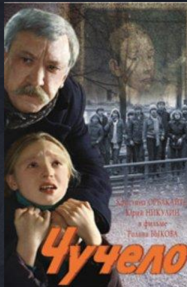
В. Железников «Чучело»

*Чтобы перейти к аргументу, кликните на прямоугольник