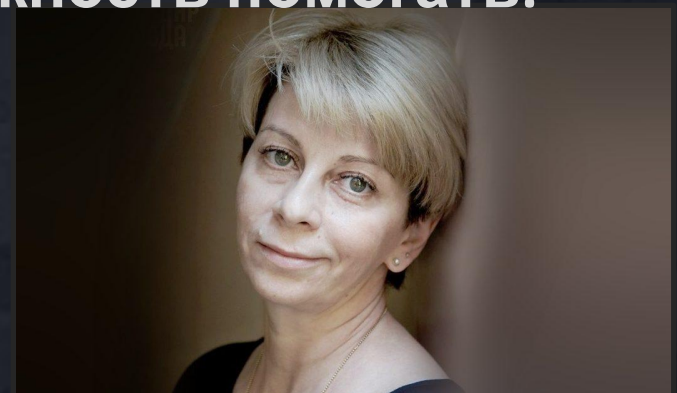
Елизавета Петровна Глинка (Доктор Лиза)

Вторым аргументом можно привести жизненные ценности Доктора Лизы. Она ставила в приоритет помощь больным и малоимущим. Глинка не ставила целью свое материальное благополучие, её жизненной ценностью была возможность помогать.