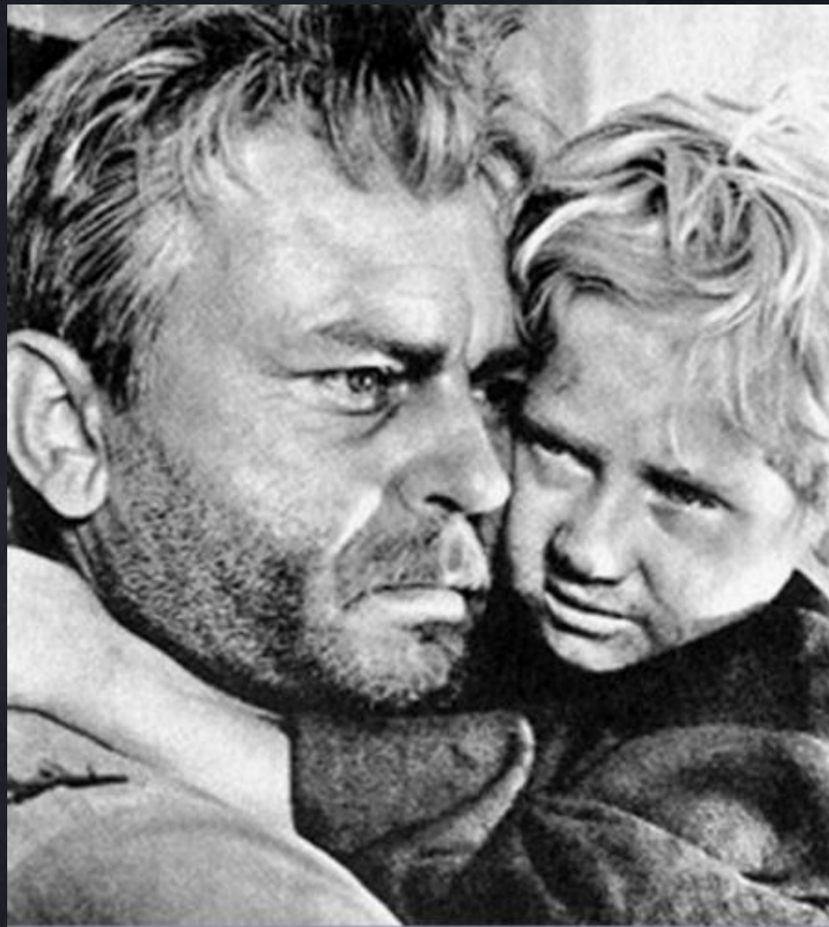
Андрей Соколов (Шолохов «Судьба человека»)

*Чтобы перейти к аргументу, кликните на прямоугольник