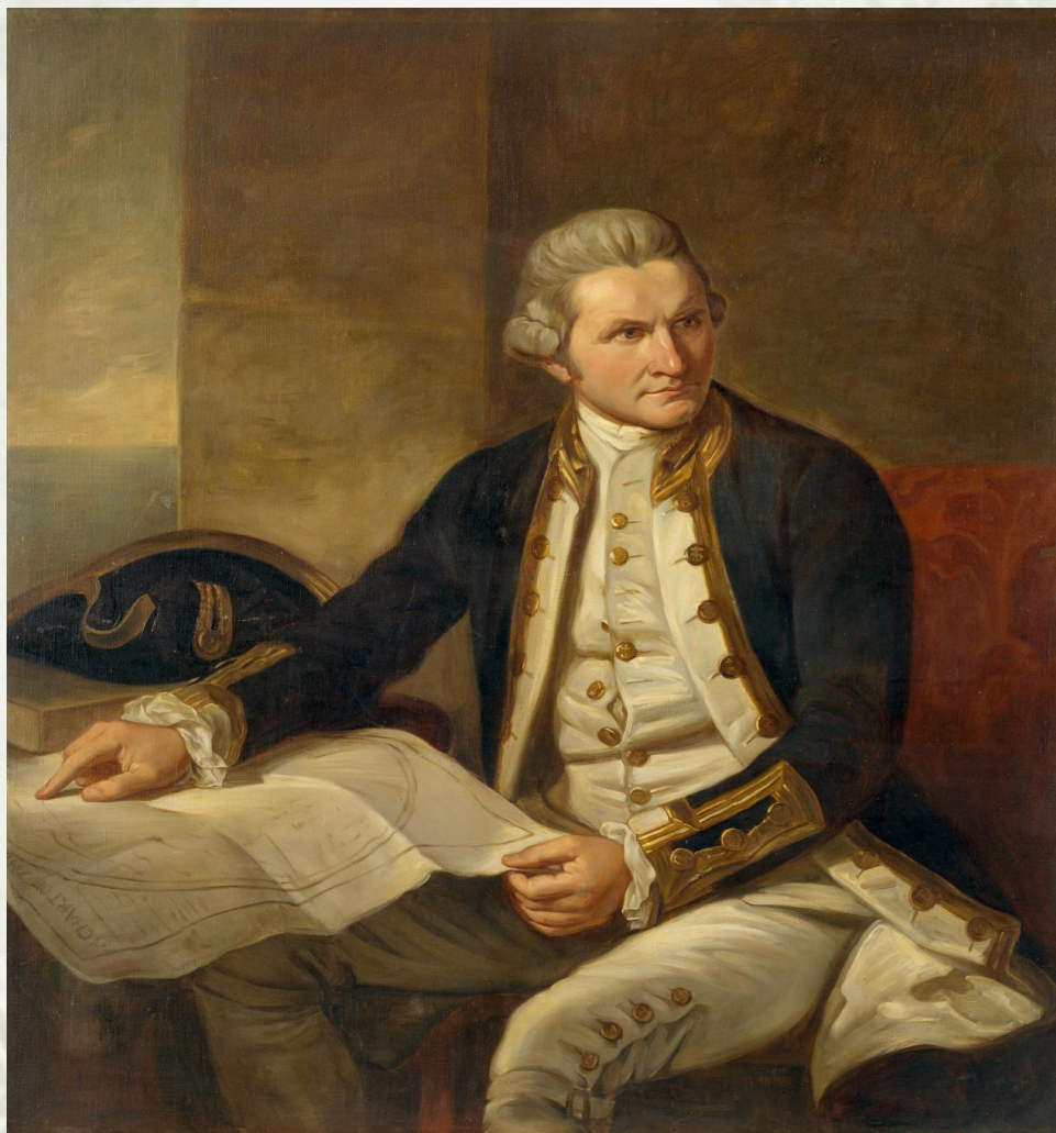
Джеймс Кук (англ)