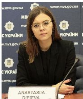
ДЕЄВА АНАСТАСІЯ ЄВГЕНІЇВНА

Заступник міністра з питань європейської інтеграції