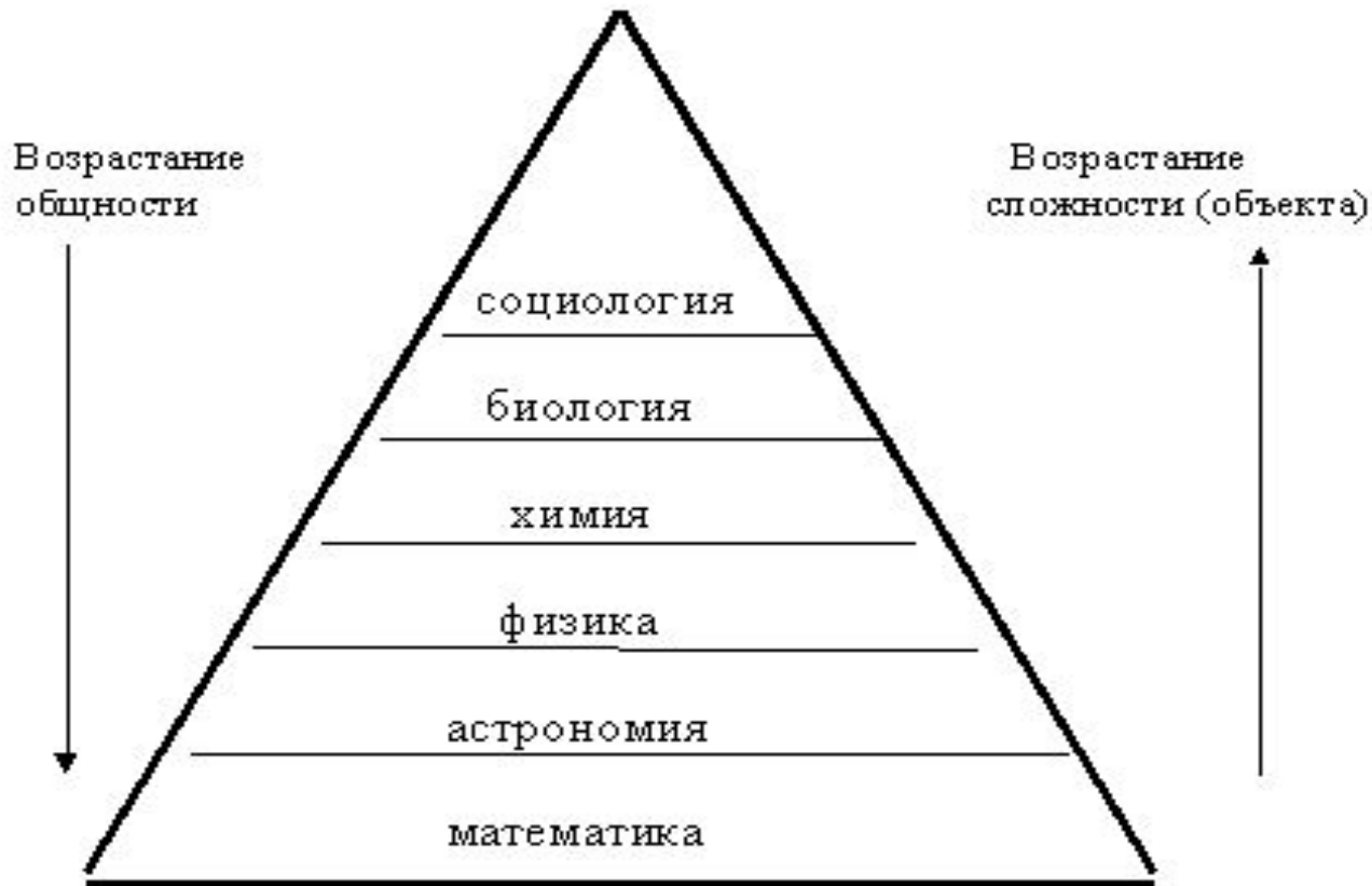
Рис.2.1. Иерархия наук по Контю