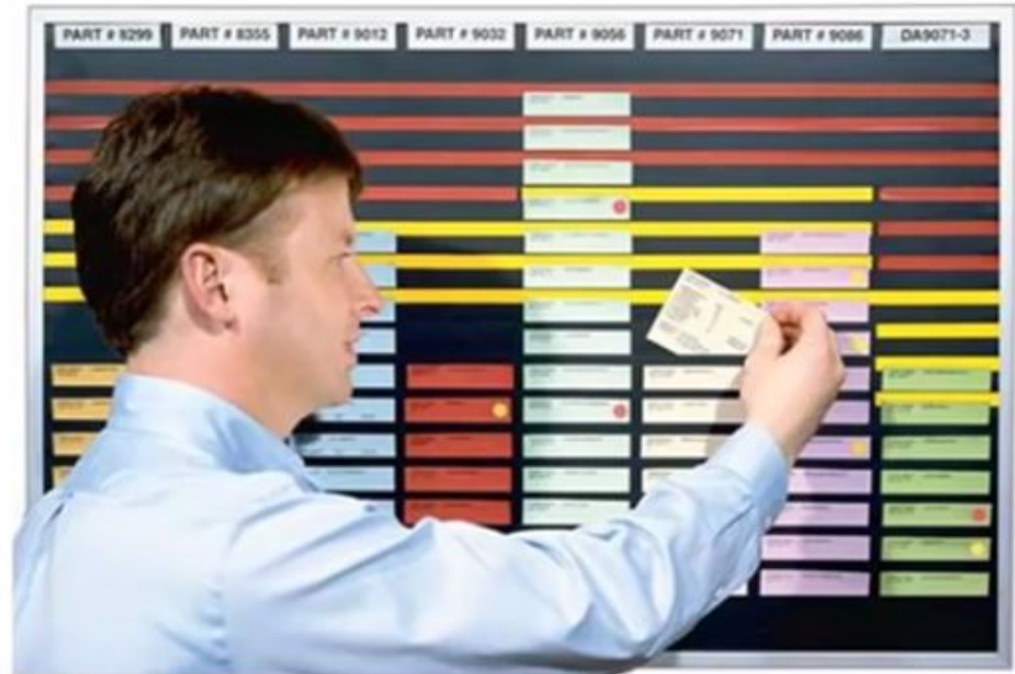
Kanban Next-Job Board CardView® System